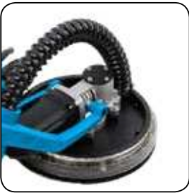
Tête articulée. Gelede kop.