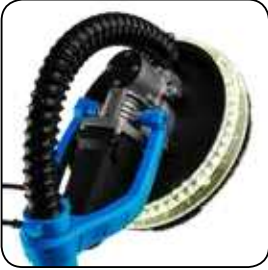
Eclairage LED sur la tête de ponçage. LED-verlichting op de schuurkop.