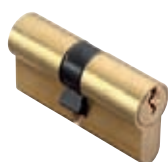
Cylindres p. 56