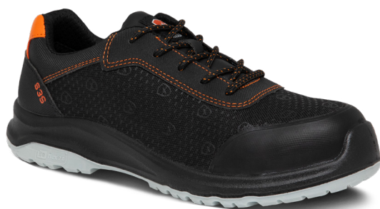
■ 9834 NOIR | 35 ▶ 48

S3S EN ISO 20345 : 2022 S3S SR FO SC CI HI NORME VERSION 2022