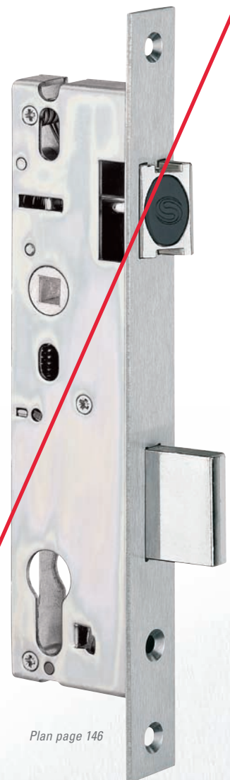
Plan page 146