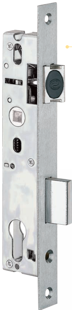
Plan page 146