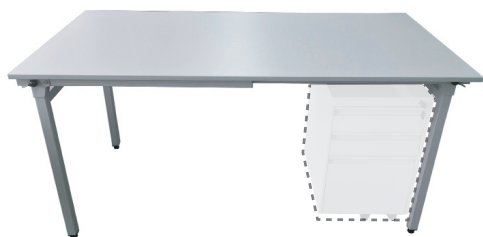
Usage possible avec caisson mobile