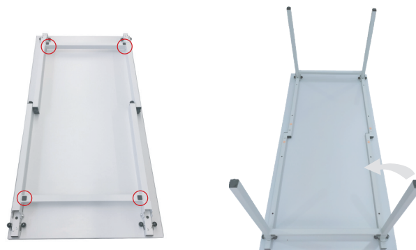
4 butées de protection pour empiler les plateaux