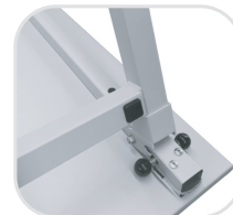
Position Pied débloqué*