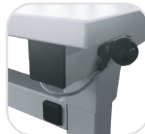
Position Pied bloqué