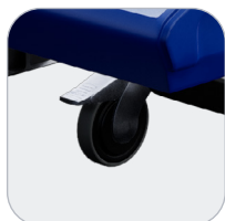
Roues escamotables à frein