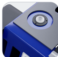
Niveau à bulle