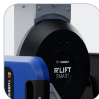
Levage manuel assisté grâce à un système de vérin à gaz breveté