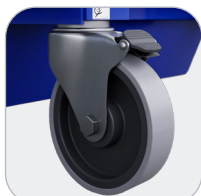
Roues escamotables à frein