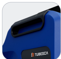
Poignées de préhension