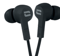
ÉCOUTEURS ÉTANCHES IPX6