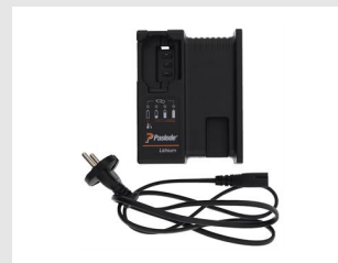
Eurocode 018881 Chargeur Paslode Lithium EU