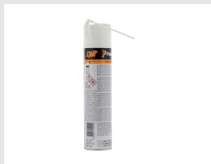
Eurocode 115251 Nettoyant IMPULSE & PULSA 300 ml