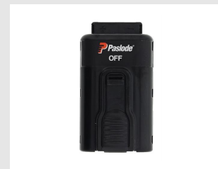
Eurocode 018880 Batterie Paslode Lithium