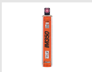
Eurocode 300346 Blister 2 cartouches IM350