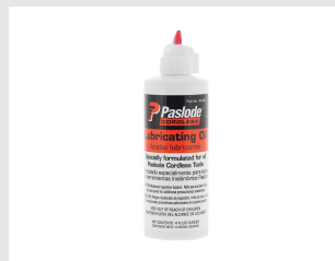
Eurocode 401482 Huile IMPULSE