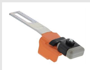
Eurocode 012082 Palpeur bardage / tuile acier IM350+