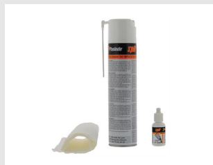
Eurocode 013690 Kit de nettoyage IMPULSE / PULSA