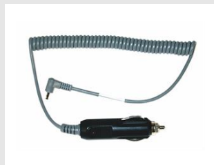
Eurocode 900507 Adaptateur de voiture