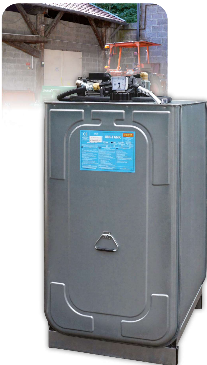
UNI PRO, compteur digital en option