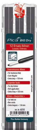
6050 Mines charpentier Sur bois sec.