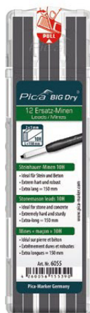
6055 Mines maçon 10H Idéal sur pierre et béton. Extrêmement dures et robustes.