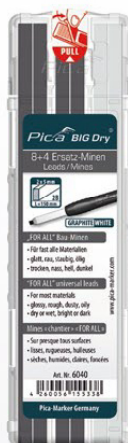
6040 Mines chantier « FOR ALL » graphite + white 8 Mines graphites + 4 mines blanches. Universelles – sur presque tous surface.