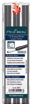
6051 ANILINE 2.0 « mines tout temps » Application « noir profond » sur bois humide.