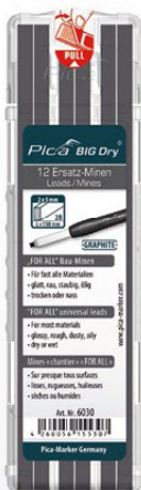
6030 Mines chantier « FOR ALL » graphite Universelles – sur presque tous surfaces.