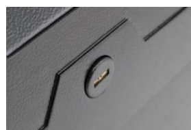
Serrure système anti-perçage