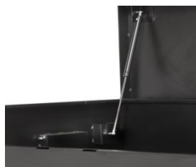
Double vérin d'ouverture