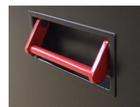
Large poignée de transport rabattable