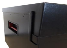
Fermeture par emboîtement anti effraction