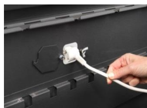
Passe fil pour cordon de charge