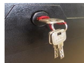
3 clés fournies