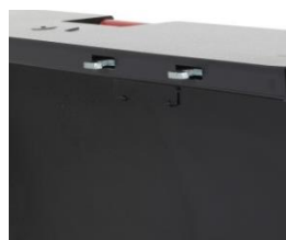
Système de fermeture unique 6 points