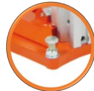
4 boulons de mise à niveau du socle

Puissante carotteuse aluminium pour le bâtiment Carottage jusqu'au Ø 300 mm