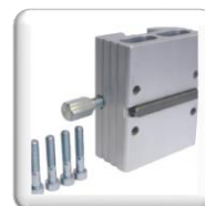
Fixation moteur STS