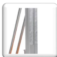
Bâti de carottage léger en aluminium