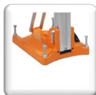
Socle ventouse / à cheviller