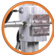
Poignée de transport