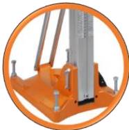
Socle combiné à cheville et à dépression