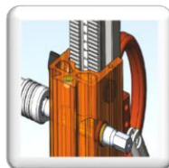
Guidage téflon d'une grande précision facilitant le réglage du jeu de chariot