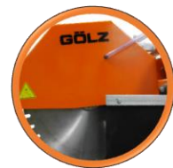
Disque Ø 650 mm

Scie de maçon châssis galvanisé pour la coupe de matériaux de construction de grande dimension.