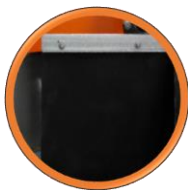
Protection caoutchouc anti projection 650x370