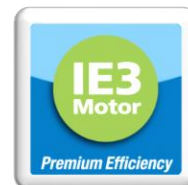
Normes sur le rendement des moteurs électriques