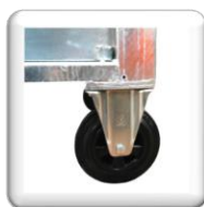
4 roues de transport dont 2 avec frein