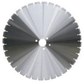
BS30 Abrasif Technique

Nous recommandons l'utilisation de nos disques diamantés pour votre BS650 :