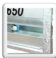
Bac à eau amovible galvanisé