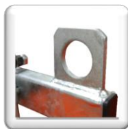
Anneau de levage central