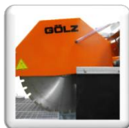
∅ disque 650 mm (profondeur de coupe 260 mm)