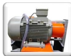
Puissant moteur électrique 5,5 kW