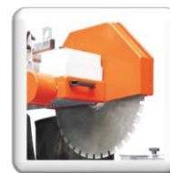
Ouverture aisée du carter de protection

IE3 : Meilleure efficacité de votre moteur, pour une consommation réduite d'énergie.