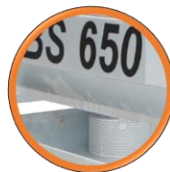
Pompe à eau électrique avec sa grille de protection