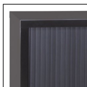
Anthracite 7016 Noir