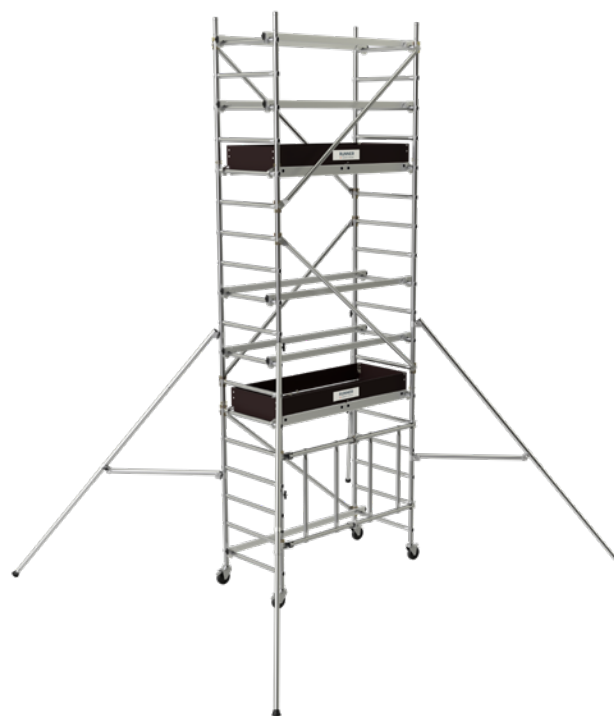
Modèle présenté : 22408541