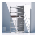
Passage des portes de 83 cm et plus