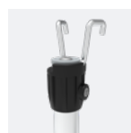
Les lisses et souslisses se mettent aisément en place à l'aide de la perche T-Grip