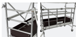
Plancher avec cadre renforcé et plinthes rapportées