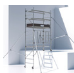
Décalage de niveau intégré