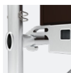
Crochets ergonomiques pour faciliter l'installation du plancher