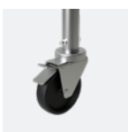
Roues Ø 125 mm à blocage ultra puissant