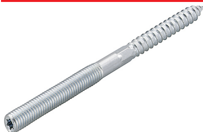
Goujon fileté STST avec empreinte TX et 6 pans