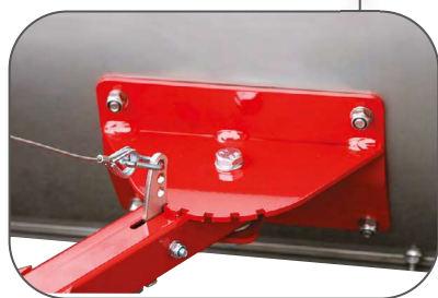
Commande d'orientation du plateau