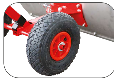
Roues gonflables, moyeu à roulement