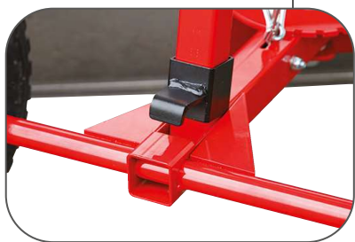
Position « stationnement »