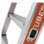
Marche antidérapante 80 mm