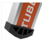
Sabots entrants antidérapants