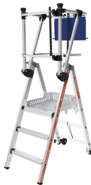
Modèle présenté : 02274303

La gamme Trekker est facile à transporter, à stocker et à utiliser même dans les endroits exigus ou les milieux occupés : sans concession sur la sécurité !