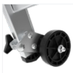
Roues de déplacements arrière escamotables