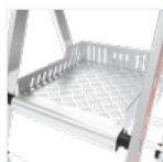
Plancher antidérapant en aluminium