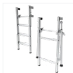
Kit de 2 réhausse amovibles en option