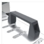
Poignée de transport