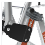
Articulations robustes avec système sécurisé de repliement pour le transport