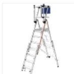
Modèle équipé de réhausse en options