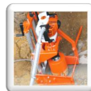
Carottage 90° sur tuyau d'assainissement. Fixation par piquet de terre (accessoire)