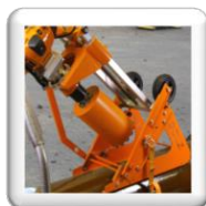
Carottage 45°. Fixation par sangle et cliquet (accessoire inclus)