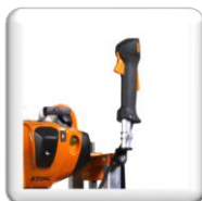
Poignée de Gaz Homme mort