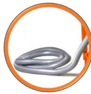
Flexible d'échappement des gaz de 4 M inclus