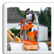
Carottage 90° sur tuyau d'assainissement. Fixation par ventouse (accessoire en option)