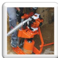
Carottage 90° sur tuyau d'assainissement. La carotteuse est coincée entre le tuyau et le blindage. Piquet de terre pour Sécurité supplémentaire