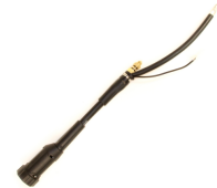
Euro Adapter for MinarcMig

L'adaptateur Euro pour MinarcMig vous offre un tout autre niveau de connectivité.