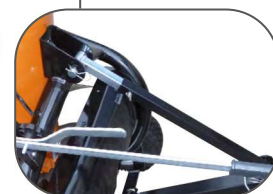
Timon réglable en hauteur