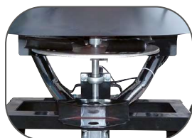
Disque et palettes en acier inoxydable