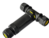
CONNECTEUR T ETANCHE RAC/TUBE-T116