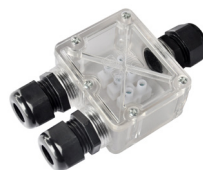
BOITIER ETANCHE IP68 RAC/BOX3-68