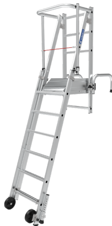
Modèle présenté : 02422200