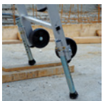
Décalage de niveau 160 mm