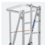
Garde-corps 360° pour plus de sécurité