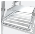
Plate-forme avec plinthes intégrées pour éviter la chute d'outils