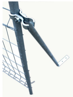
Jambe de force avec bride