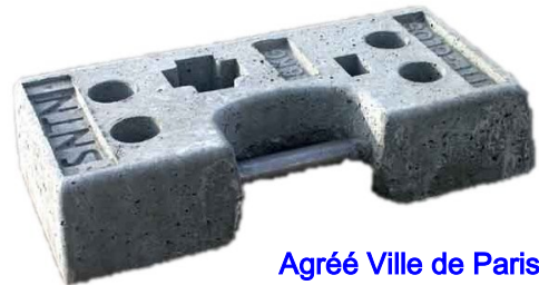
Agréé Ville de Paris