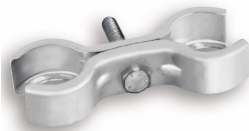
Bride de verrouillage

Socle béton avec poignée de renfort MANIPILOT ®