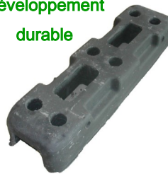
Plot PVC recyclé

Socle béton avec poignée de renfort MANIPILOT ®