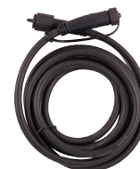
RALLONGE POUR SPOT 12V RGB 1M OU 2.5M DEC/R1M-24ET - DEC/R2M-24ET