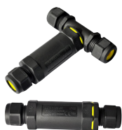
CONNECTEURS ETANCHES RAC/TUBE-T116 RAC/TUBE-116