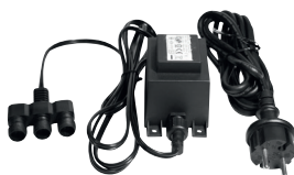
TRANSFORMATEUR 12V 50W DEC/TR50-ET