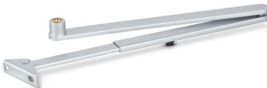
Bras à compas standard