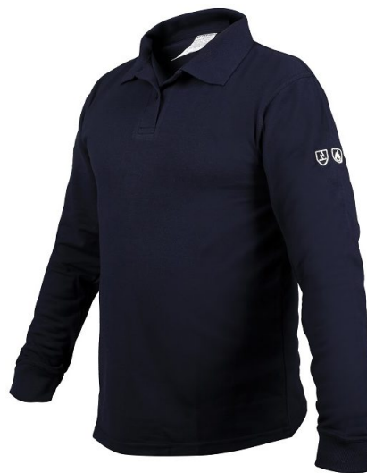
Polo piqué Multirisques