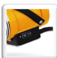
Interrupteur Marche / Arrêt