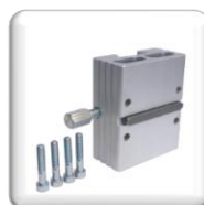
Plaque de fixation rapide STS