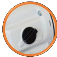
Sélecteur de 3 vitesses 180/430/750.