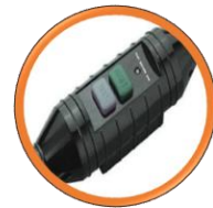
Sécurité Commutateur PRCD 30 MA.

Moteur de carottage professionnel - 3 vitesses.