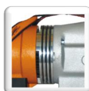
Ouvertures d'évacuation de l'air