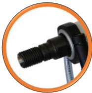
Emmanchement, Raccord 1¼" UNC.