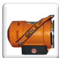
Moteur Électrique 3300 W