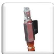
Raccord d'eau Gardena