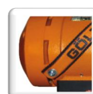
Ouvertures d'admission de l'air