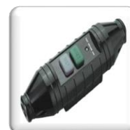
Sécurité Commutateur PRCD 30 MA