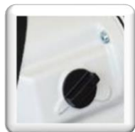
Sélecteur 3 vitesses