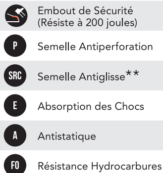
TABLEAU NIVEAU DE SÉCURITÉ