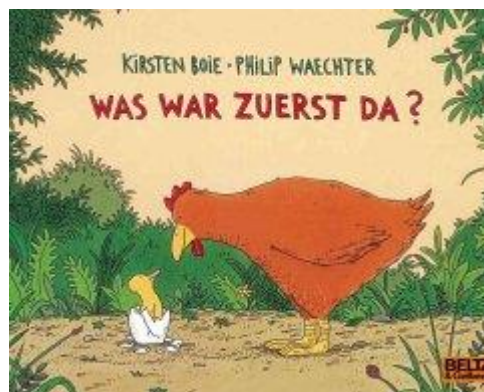
Figure 1: https://www.buecher.de/shop/biologie/was-war-zuerst-da/boie-kirstenwaechter-philip/products_products/detail/prod_id/25645959/

Was würdest du der Henne antworten? Bist du mit ihr einverstanden oder hast du eine andere Antwort parat? Schreibe deine eigene Antwort auf die Frage „Was war zuerst, Huhn oder Ei?“ auf und begründe sie.