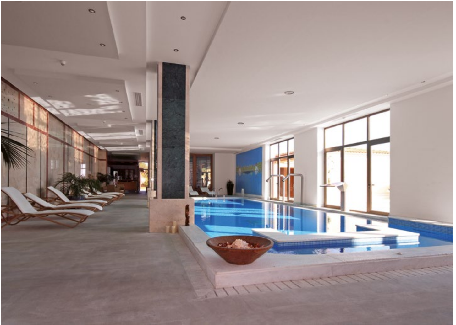
Schwimmbad - Wellnessbereich