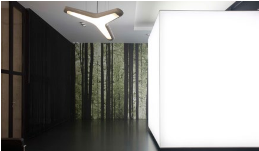
Gesundheitszentrums - Belgien

Eine gute Akustik bedeutet auch eine neue, ruhigere Atmosphäre – ein echter Vorteil für Ihre Wartezimmer und Praxen.