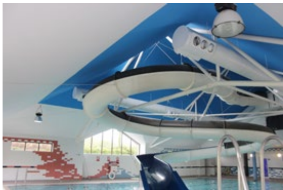
Schwimmbad - Freizeitanlage - Großbritannien

SO CLEAN erfüllt auf präzise Weise die spezifischen Bedürfnisse von Krankenhäusern, Arztpraxen, Wartezimmern, aber auch von Schwimmbädern und Spas, indem sie aktiv eine hygienische und beruhigende Umgebung schafft.