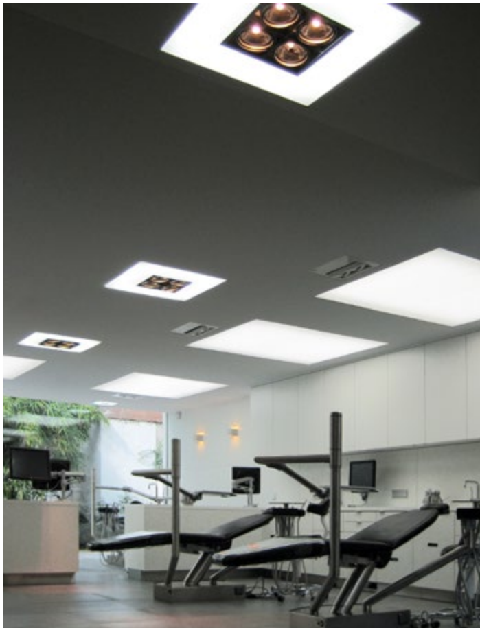
Kelderman Kieferorthopädie - Architekt : ARHK