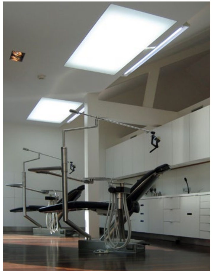
Kelderman Kieferorthopädie - Architekt : ARHK