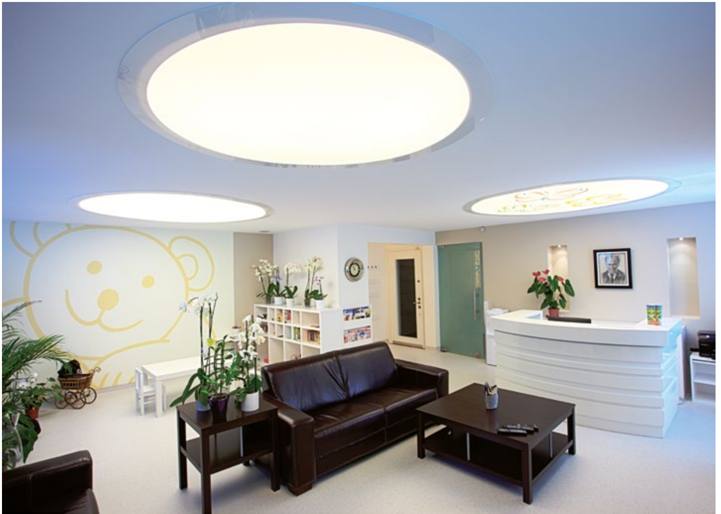
Wartesaal eines Gesundheitszentrums - Türkei