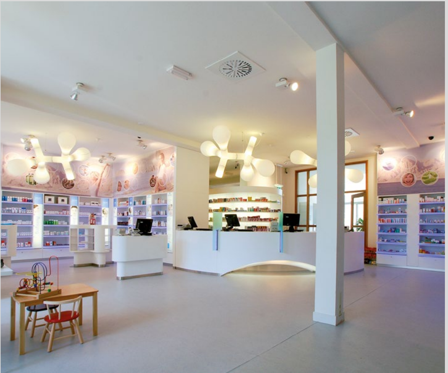
Apotheke - Deutschland