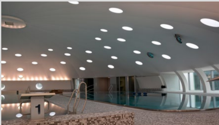
Schwimmbad Lingolsheim - Frankreich