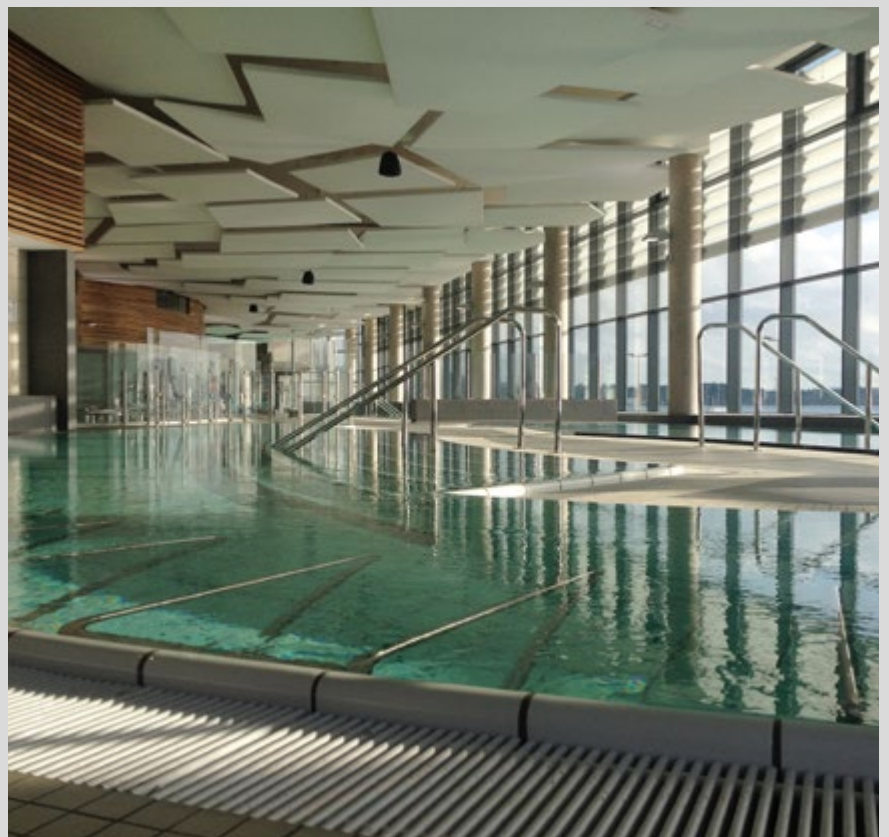
Thermen von Ballaruc - Frankreich

Die Decken und Wände, die mit der mit Sanitized® behandelten Verkleidung bespannt wurden, sind und bleiben dadurch frei von jeglichem Milbenbefall. Als regelrechte Barriere gegen Bakterien und Schimmel bleibt Sanitized® dauerhaft aktiv und effektiv, selbst nach einer Behandlung mit Desinfektionsmitteln.