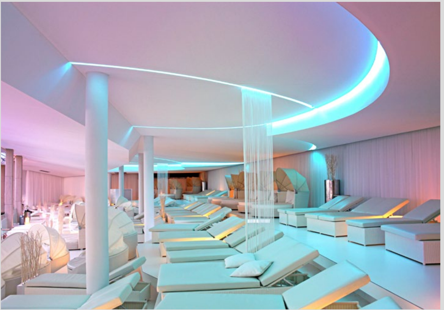
Badewald Wasserwelt - Sinsheim - Deutschland