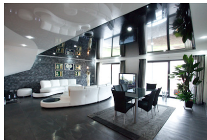
Die Kombination aus weißer und schwarzer CILING-Hochglanzdecke verstärkt das edle Ambiente des komplett in Schwarz-, Weiß- und Grautönen gehaltenen Raumes und lässt das Wohnzimmer schön hell, riesig hoch und trotz der Größe ausgesprochen wohnlich wirken.