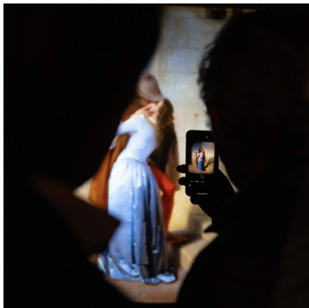
Francesco Hayez The Kiss , 1859 (112 x 88 cm) Original: Pinacoteca di Brera Digital Artwork (DAW®)

Espinasse31 è lieta di annunciare la collaborazione con Cinello , azienda italiana impegnata nel delicato compito di promuovere e valorizzare il patrimonio artistico su scala nazionale e internazionale. Con il suo brevetto è in grado di proteggere i file digitali delle opere d’arte di musei, collezioni private ed artisti contemporanei garantendone originalità e non copiabilità. Cinello ha aperto le porte ad una nuova forma di fruizione e collezionismo d’arte, grazie ai DAW® - Digital Art Work , opere d’arte digitali in altissima definizione, numerate e autenticate. Nell’occasione dell’esposizione di Milano sarà possibile ammirare la versione digitale di grandi capolavori italiani quali la Testa di giovane donna di Modigliani e Il Bacio di Hayez , i cui originali sono esposti nel museo Pinacoteca di Brera di Milano.