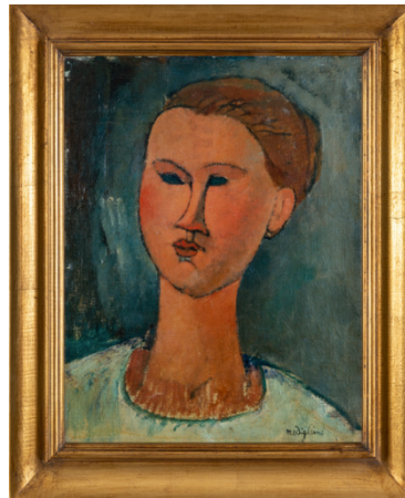
Amedeo Modigliani Head of a Young Lady , 1915 (46 x 38 cm) Original: Pinacoteca di Brera Digital Artwork (DAW®)

L’installazione di Giuseppe Lo Schiavo , la cui ricerca artistica mira ad investigare il rapporto tra elementi in opposizione: creazione-distruzione, passato-futuro, reale-digitale, accoglie il visitatore che entrando in galleria si sentirà immediatamente trasportato in un’altra dimensione. La coperta termica utilizzata dall’artista allo stesso tempo fragile ma resistente è ricca di significati simbolici. Materiale sviluppato originariamente dalla NASA , ora