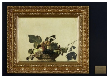
Canestra di Frutta, de Caravaggio

Según explica el filósofo coreano Byung-Chul Han en su libro "Shanzai", en el pensamiento de Oriente no existe la idea de original. Los chinos tienen dos conceptos para designar la copia: el término 'fangzhipin' refiere a las creaciones en las que es evidente la diferencia respecto del original, mientras que 'fuzhipin' alude a una reproducción exacta que tiene el mismo valor que la original, sin una connotación negativa.