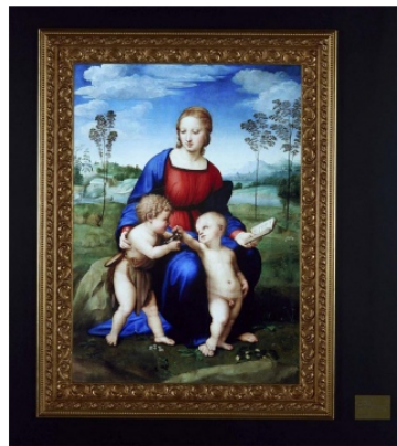
Madonna del Cardelli, de Rafaelle Sanzio