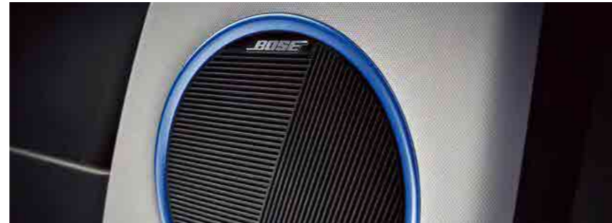
מערכת שמע מבית BOSE*