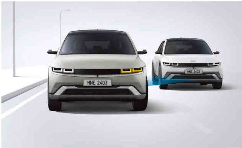
מערכת אקטיבית לזיהוי ומניעת התנגשות בכלי רכב ב"שטח מת" (BCA) מערכת מבוססת רדאר המתריעה על רכבים ב"שטח מת" בעת מעבר נתיב ומבצעת תיקון הגה אוטומטי במידה והנתיב אינו פנוי.