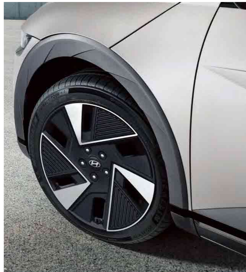
חישוקי סגסוגת 19*"