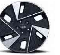
חישוקי סגסוגת 19"