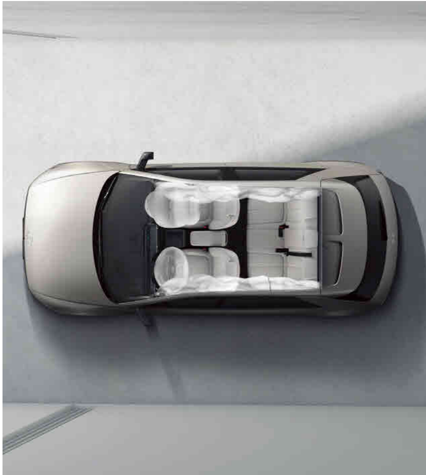
7 כריות אוויר

טכנולוגיות מתקדמות מספקות הגנה מרבית המאפשרת לכם ליהנות מחוויית נסיעה רגועה יותר ובטוחה יותר.