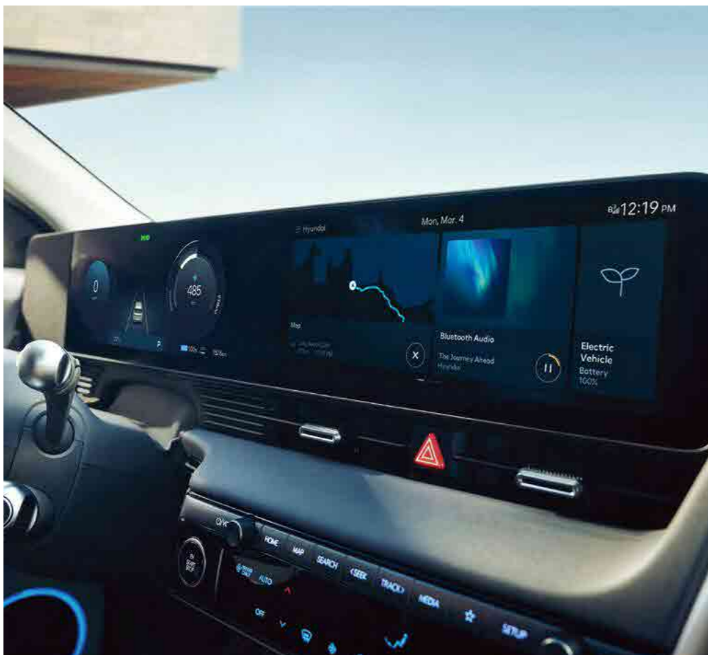
צג רחב המשלב מערכת מולטימדיה ולוח מחוונים בגודל 12.3" עם תמיכה בעברית

יונדאי IONIQ 5 משדרגת את היום-יום שלכם. השילוב בין יכולות דיגיטליות מתקדמות ופונקציונליות המציעים נוחות אינטואיטיבית.