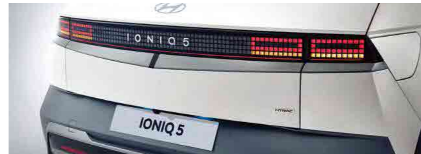
תאורת LED אחורית