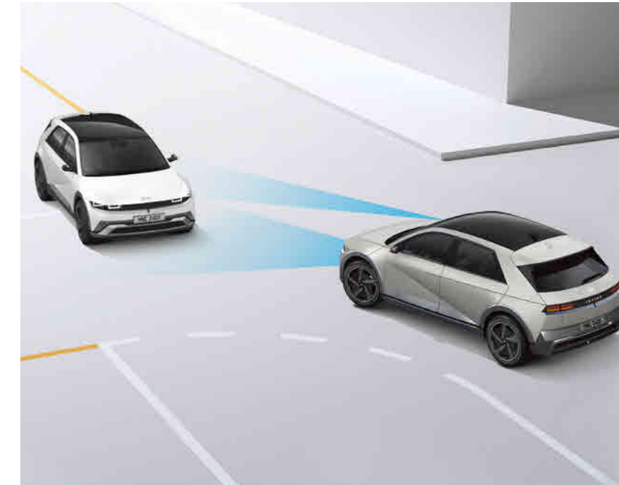
בלימה אוטונומית במצבי חירום (FCA-JT)

מערכת אקטיבית המתריעה מפני סכנת התנגשות. במידה וסכנת ההתנגשות עולה לאחר ההתרעה המערכת תבצע בלימת חירום אוטומטית. המערכת כוללת זיהוי כלי רכב, דו גלגלי ותנועה חוצה בצומת.