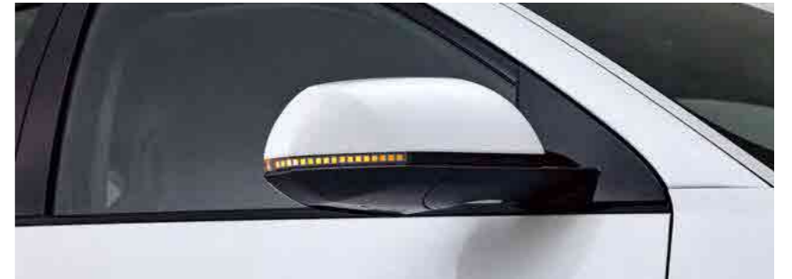
פנסי איתות במראות LED