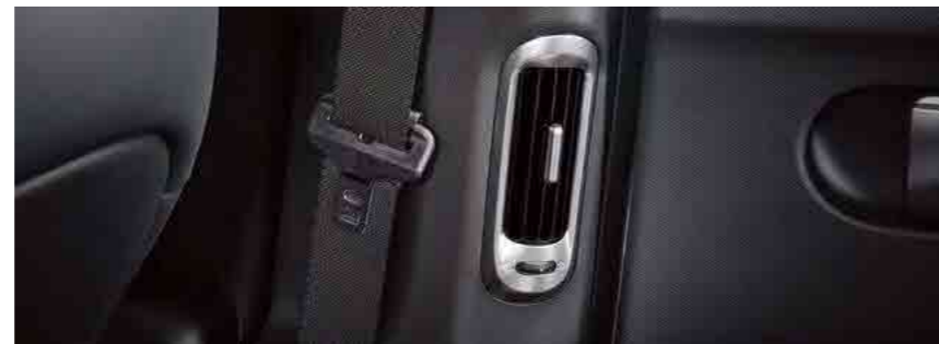
פתחי מיזוג אוויר למושב האחורי