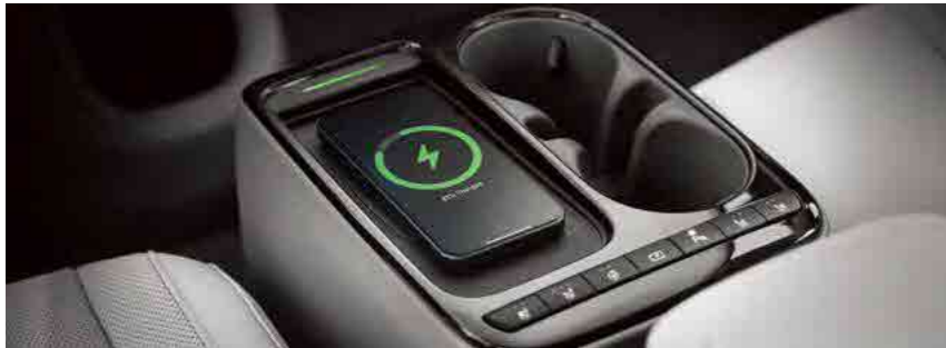
טעינה אלחוטית לנייד (לטלפונים התומכים בטכנולוגיית Qi)*