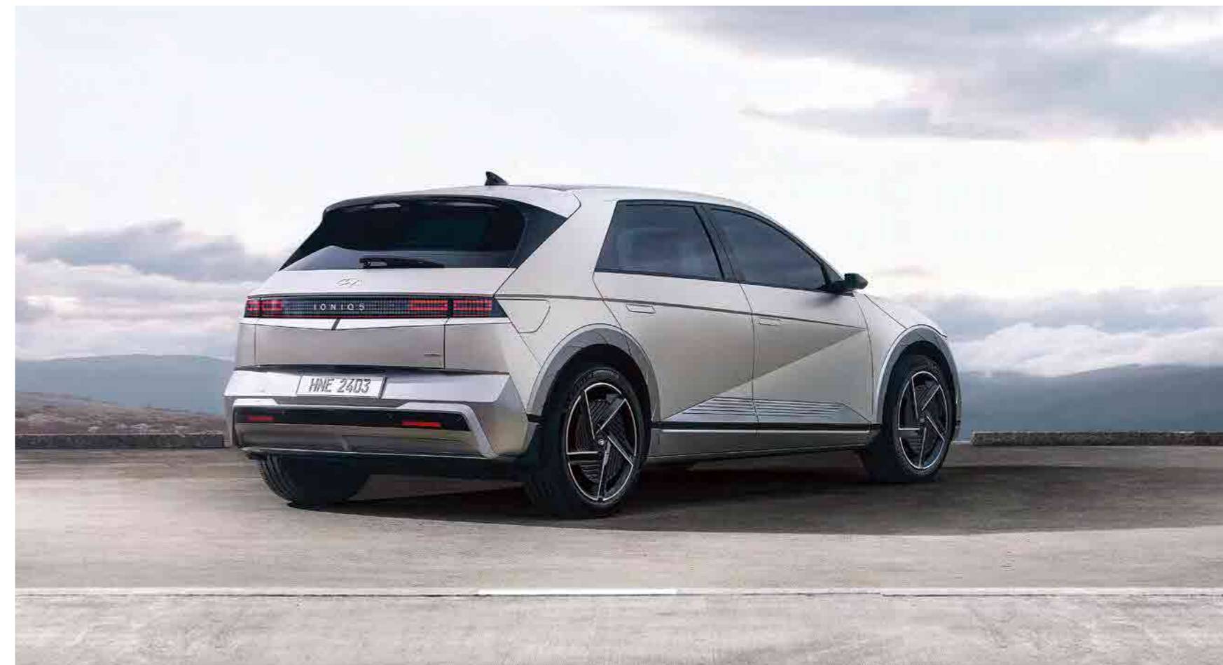
פגוש אחורי רחב בשילוב פנסים בטכנולוגיית LED

עיצוב הפגוש האחורי בשילוב פנסי ה-LED והספویلר מעניקים ל-IONIQ 5 מראה חלק.