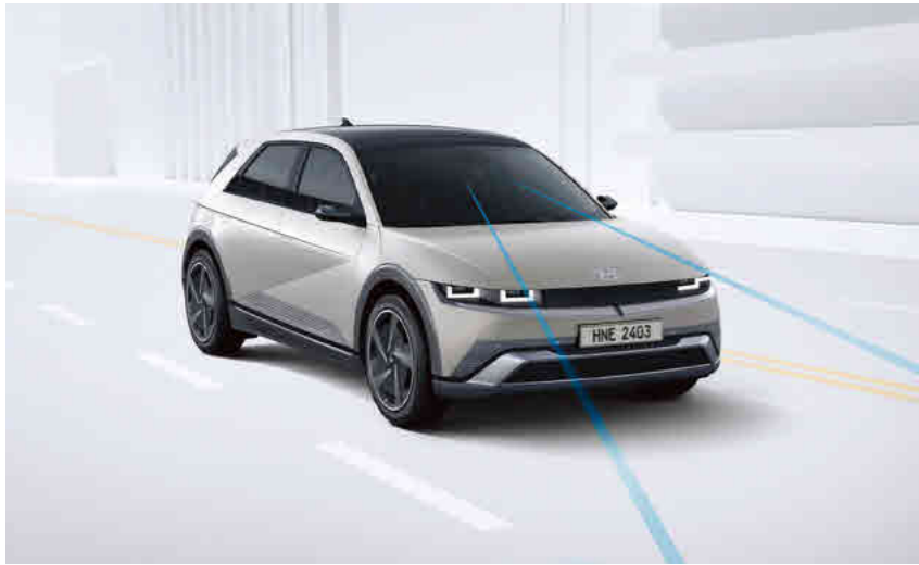
מערכת אקטיבית הכוללת תיקון הגה (LKA)

ליהנות ממערכות עזר וממערכות בטיחות ברמה הגבוהה ביותר. יונדאי 5 IONIQ צוידה במערכות הבטיחות ובמערכות העזר המתקדמות והחדישות ביותר כדי שתוכלו לנהוג בראש שקט.