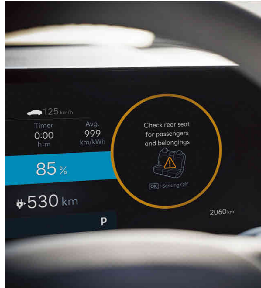
חיווי תזכורת על שיכחת ילד/נוסע במושב האחורי (ROA)