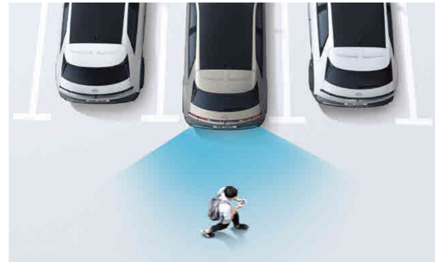
מערכת אקטיבית להתראה ומניעת התנגשות בעת כניסה ויציאה מחניה (PCA)*