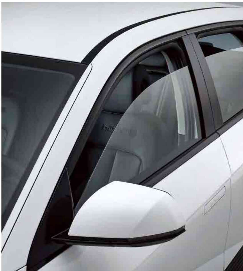
קיפול מראות חשמלי

כל מילימטר ב-IONIQ 5 טופל בקפידה, כולל פרטי הגלגלים, במטרה לחזק את העיצוב האייקוני ולשדרג את המאפיינים האווירודינמיים שלה.