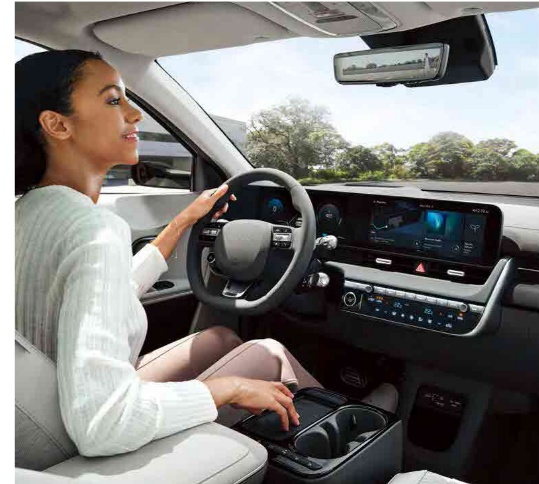
מראה מרכזית מתכהה נגד סינוור ECM