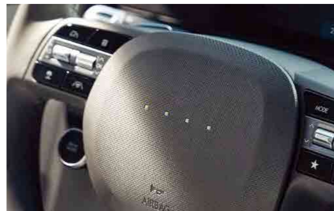
תאורת פיקסלים אינטראקטיבית המופיעה בעת הפעלה, נסיעה לאחור וטעינה.