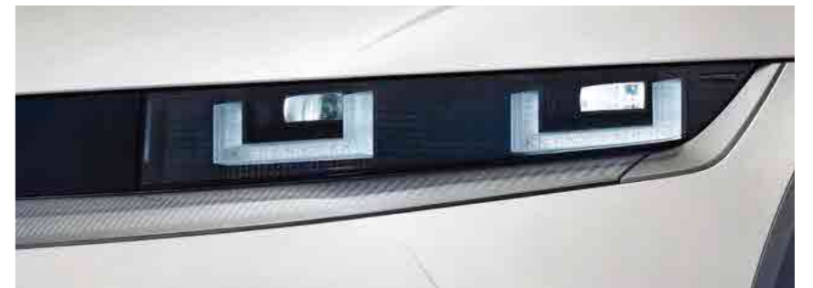
תאורת LED קדמית