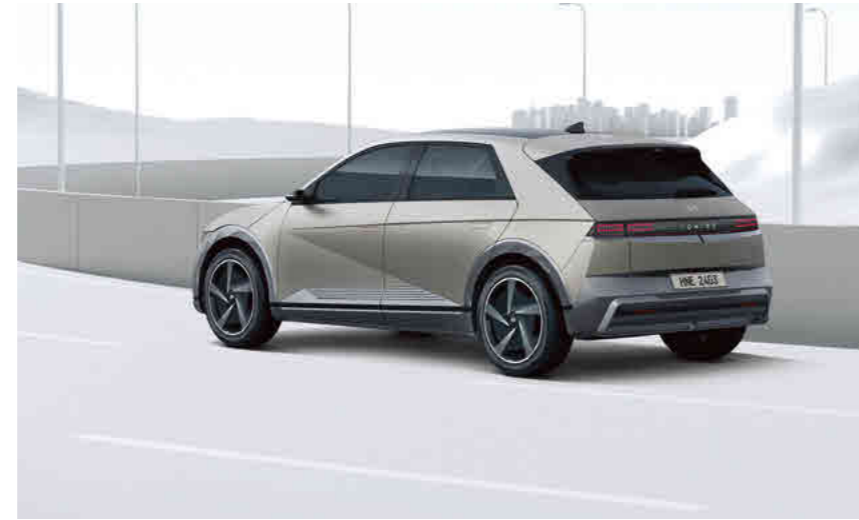
בקרת שיוט חכמה הכוללת מנגנון זחילה בפקקים (SCC)

מערכת אקטיבית הכוללת תיקון הגה לסיוע בשמירה על נתיב הנסיעה. כאשר המערכת מזהה סטייה מנתיב הנסיעה, היא מבצעת תיקון הגה אוטומטי בכדי למנוע את הסטייה מנתיב הנסיעה.