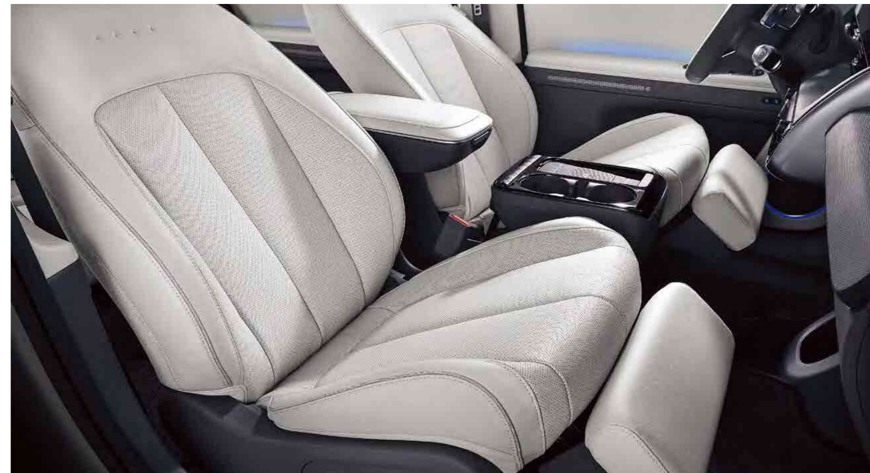
Relaxation Seat מושבים קדמיים מתכווננים הניתנים להטיה מלאה*