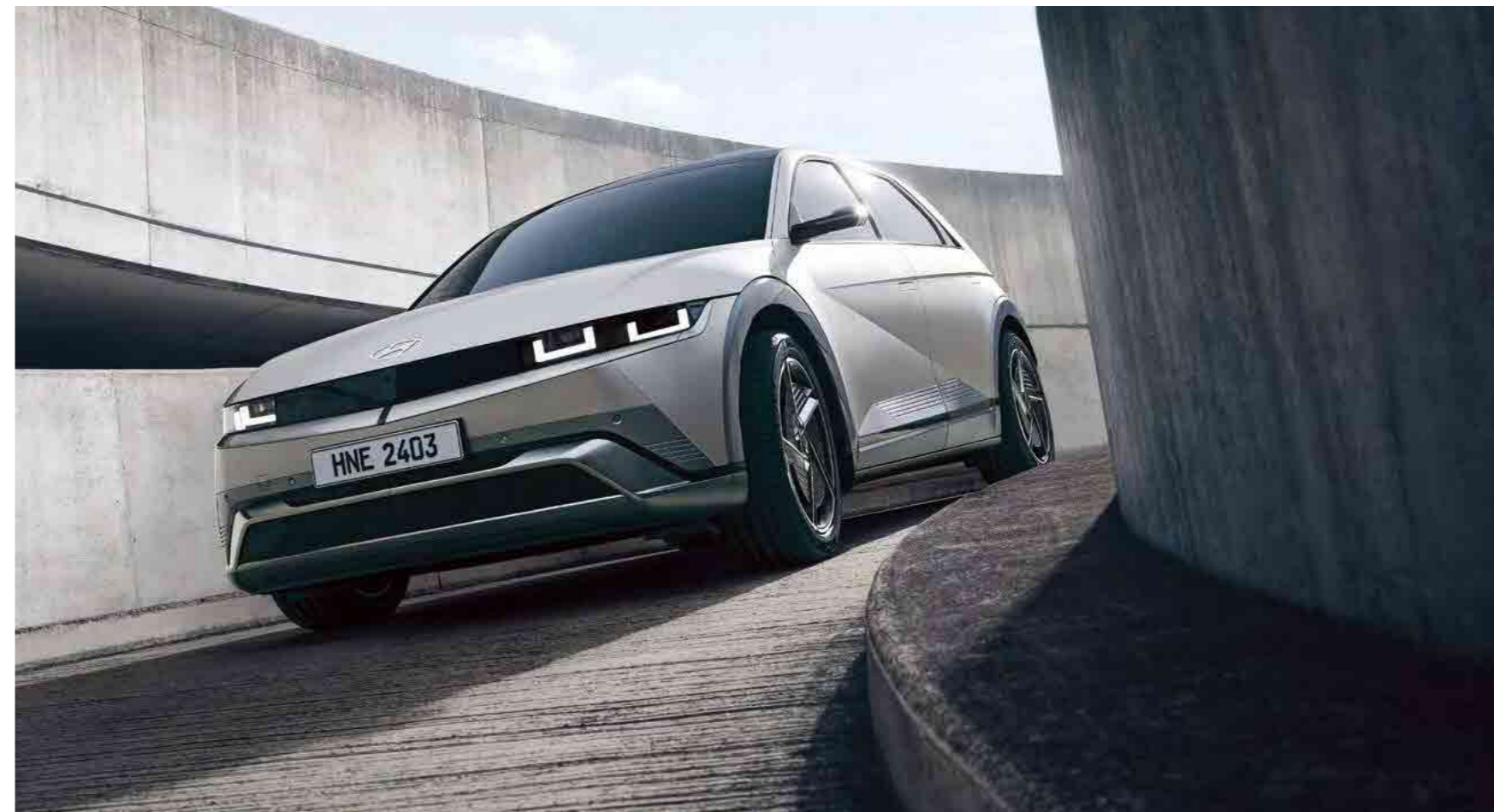
פגוש קדמי רחב המשלב פנסי LED