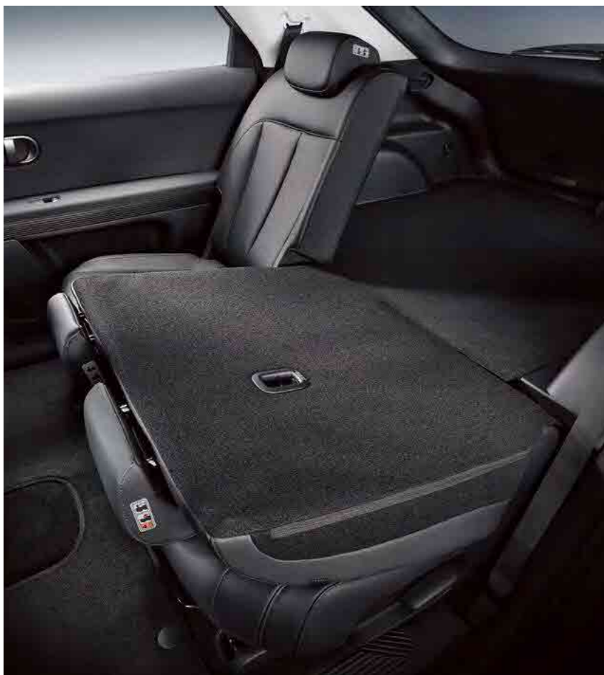
קיפול מושבים אחוריים

שילוב חומרים יוקרתיים בעיצוב מינימליסטי מעניק לכם נוחות מקסימלית בחלל הפנים.