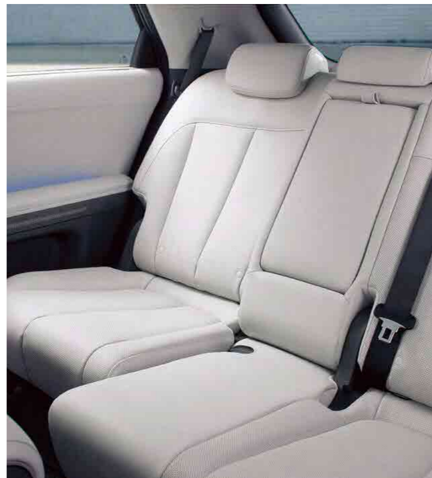
מושב אחורי עם אפשרות כיוון