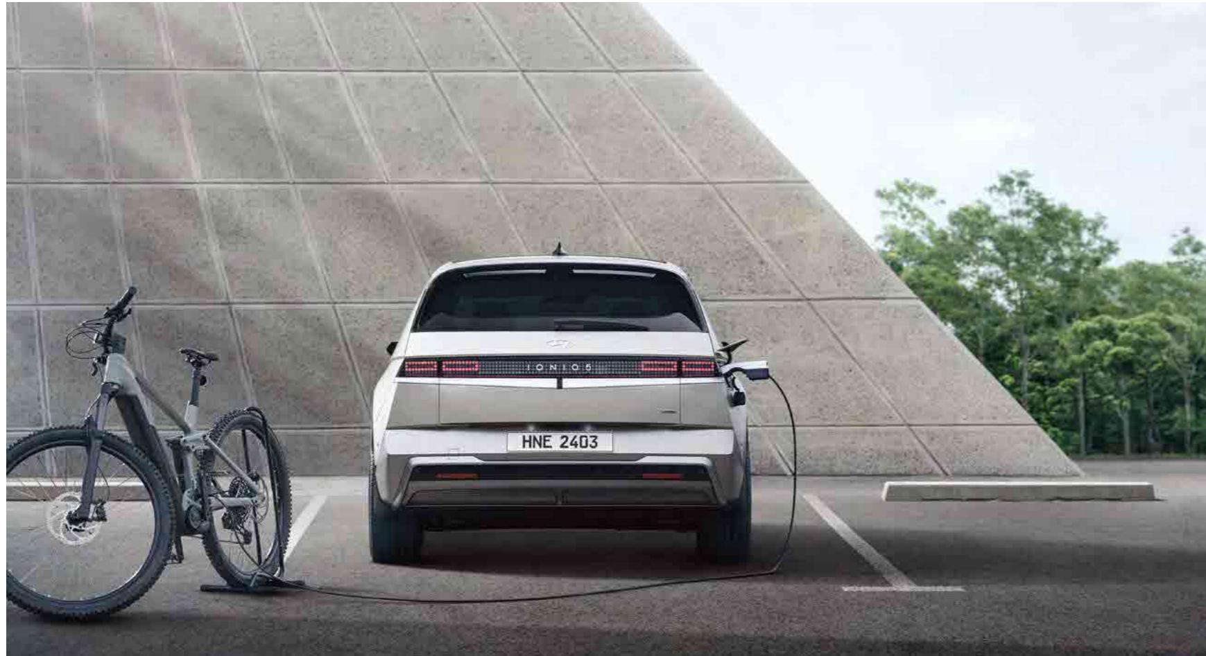
אפשרות לטעינה חיצונית של מוצרי חשמל V2L (אביזר בתוספת תשלום)

מגוון אלמנטים חדשניים ושימוש בטכנולוגיות חכמות ומתקדמות.