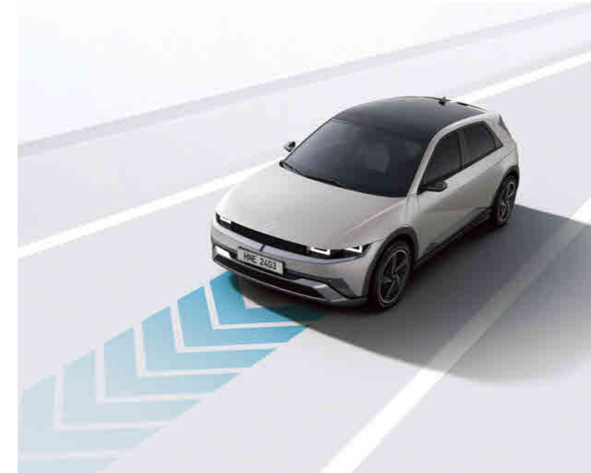
מערכת סיוע לשמירה על מרכז נתיב הנסיעה (LFA) מערכת אקטיבית המסייעת בשמירה על מרכז נתיב הנסיעה.