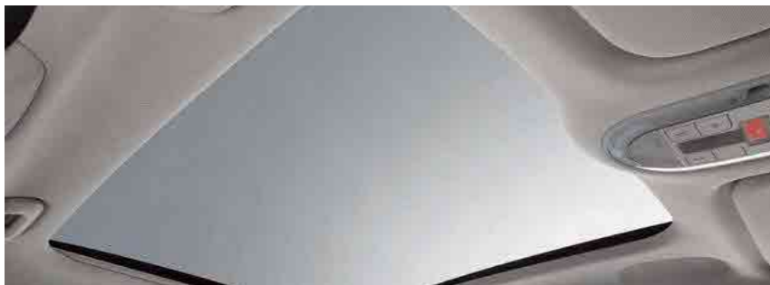
גג שמש פנורמי*