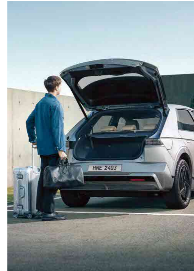
דלת תא מטען חשמלית חכמה עם אפשרות לכיוון גובה ומהירות