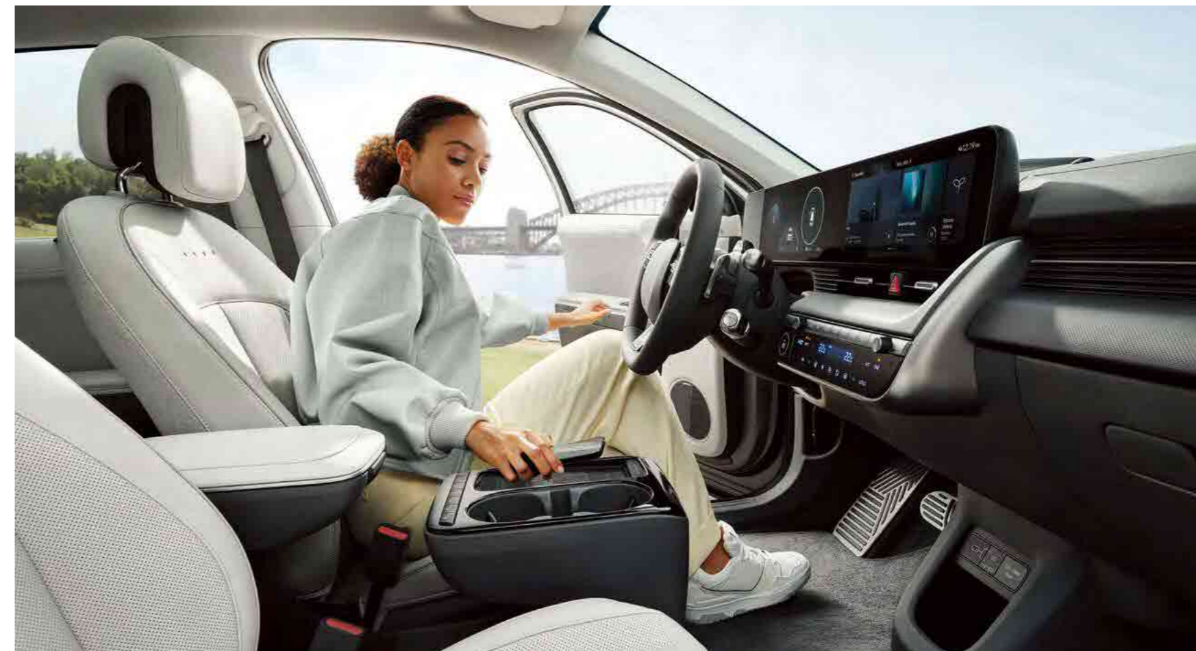
קונסולה מרכזית צפה הניתנת להזזה עד 14 ס"מ, בשילוב משטח טעינה אלחוטי** ולחצן לחימום ואוורור מושבים קדמיים*.