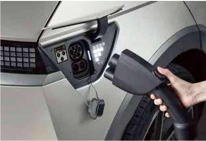
פתח טעינה חשמלית ותאורת פיקסלים המראה את מצב הסוללה

טווח הנסיעה וצריכת החשמל בפועל מושפעים, בין היתר, גם מתנאי הדרך, מתחזוקת הרכב, ממאפייני הנהיגה ומקיבולת ובלאי הסוללה, ועל כן הם יכולים להיות שונים בהשוואה לנתוני המעבדה. *זמן הטעינה בפועל עשוי להיות שונה והוא תלוי בגורמים שונים ביניהם בין היתר נתוני עמדת הטעינה, תנאי הטמפרטורה ומצב טעינת הסוללה בפועל.