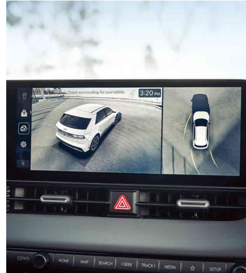
מערך מצלמות היקפי (SVM)*