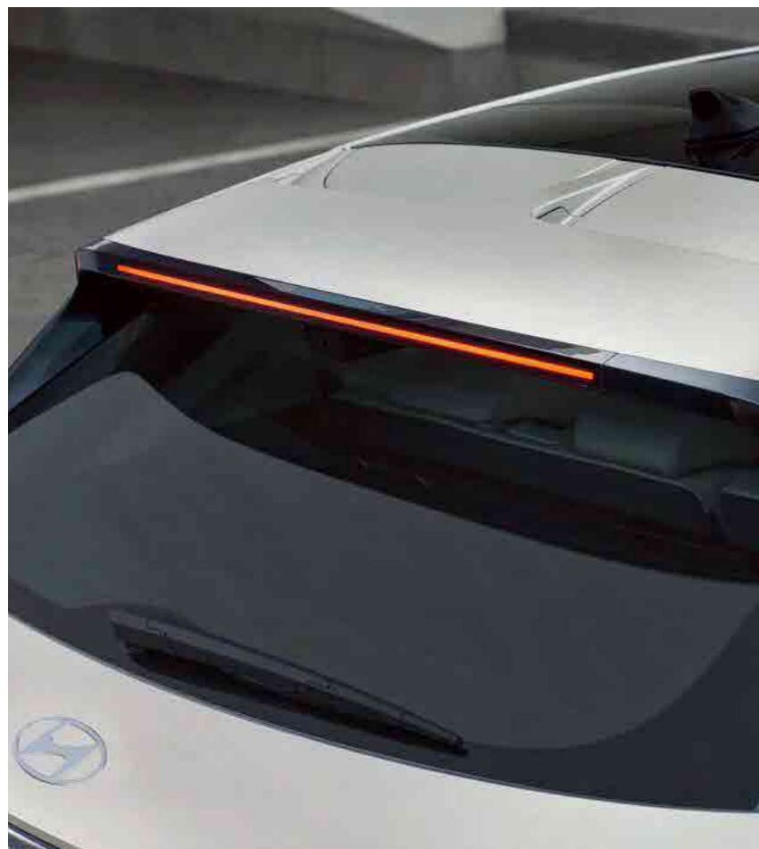
ספویلר אחורי אווירודינמי בגג