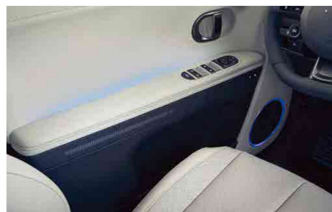
תאורת אווירה משתנה*