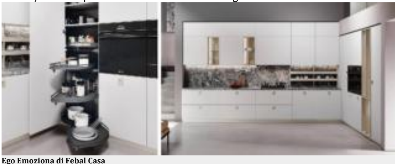
Ego Emoziona di Febal Casa

Per la cucina con sviluppo angolare, la colonna è attrezzata all'interno con vassoi girevoli e estraibili: così, accedere al contenuto è facilissimo. Grazie alla forma ergonomica dei ripiani che compongono il funzionale meccanismo Le Mans, si sfruttano anche gli "angoli morti" del vano, aumentando la superficie utile fino al 70%. Robusti e regolabili in altezza, ruotano e possono essere estratti in modo agevole.