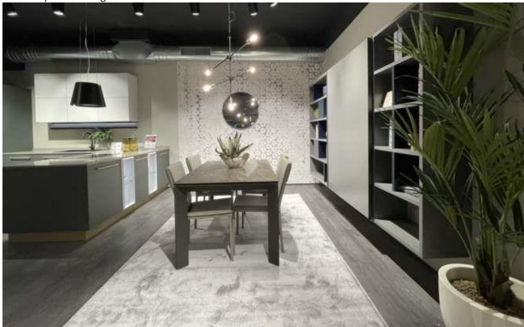
L'interno dello showroom da 450 mq di Mira, in provincia di Venezia