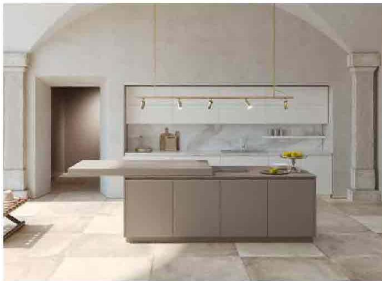
FEBAL Era. Blocco cucina con ampio piano scorrevole