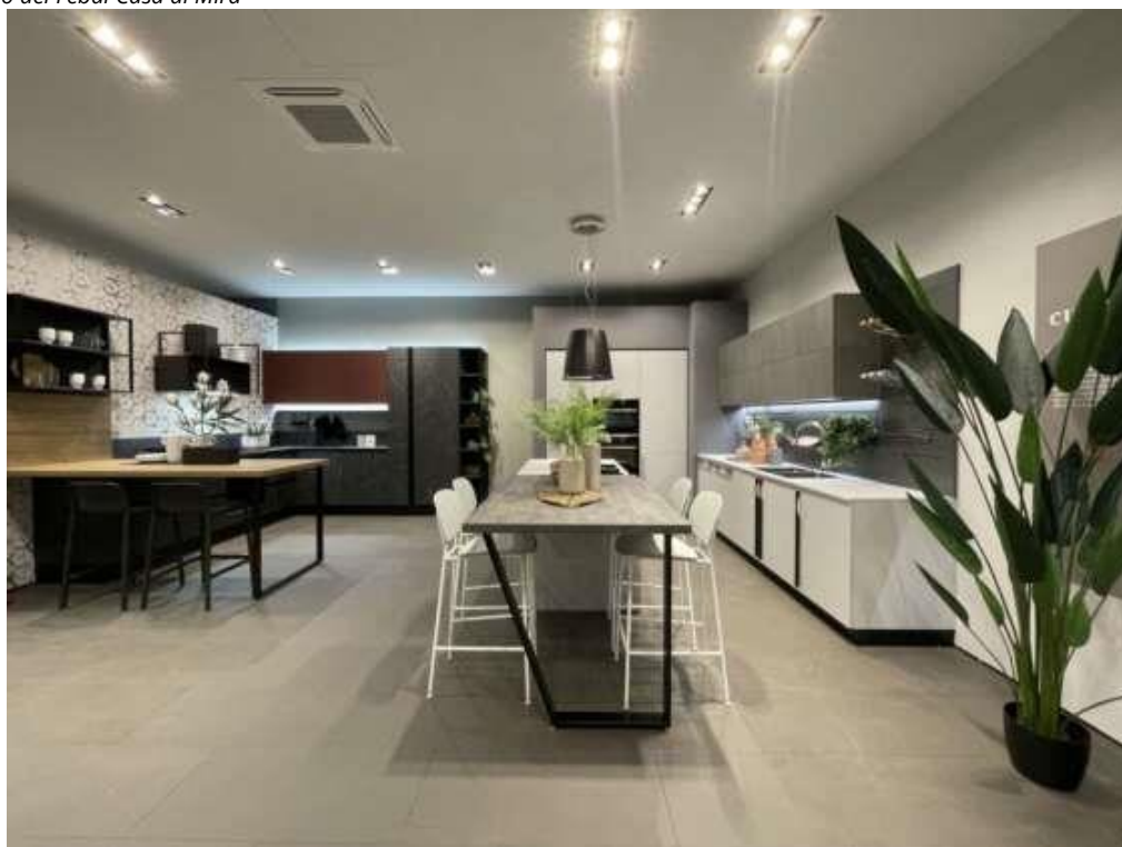
Lo store di 300 mq di Adigeo, in provincia di Verona

Il Liguria Febal ha aperto uno store di 250 mq a a Campi , zona commerciale in provincia di Genova, in via Perini 22 e uno store di 500 mq è stato inaugurato in Sardegna, a Nuoro , in