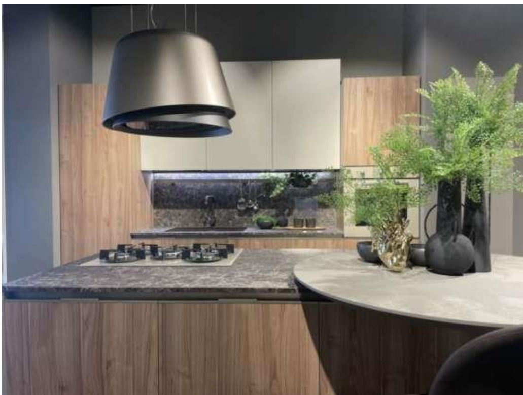
Il monomarca aperto a Bologna in via San Felice 78