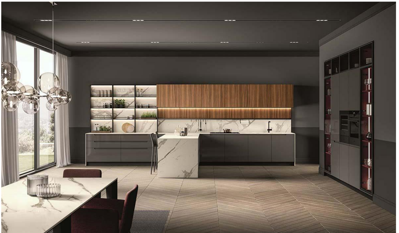
Traccia by Febal Casa, Design Andrea Federici

La cucina diventa prolungamento del living, non più un locale isolato, ma un luogo da vivere in perfetta coerenza con l'area pranzo. Gli ambienti giorno e notte interagiscono e si integrano tra loro. Tutto questo grazie a una progettazione attenta che prevede piani cottura a vista, tavoli snack, isole o strutture di appoggio, boiserie con illuminazione integrata, ma anche grazie alla cura dei dettagli e allo studio dei materiali come nel caso di carte da parati impermeabili quindi utilizzabili anche in cucina.