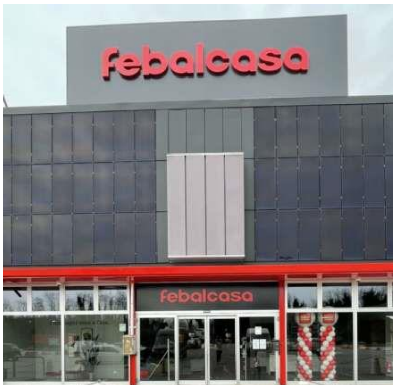
L'esterno del Febal Casa di Mira