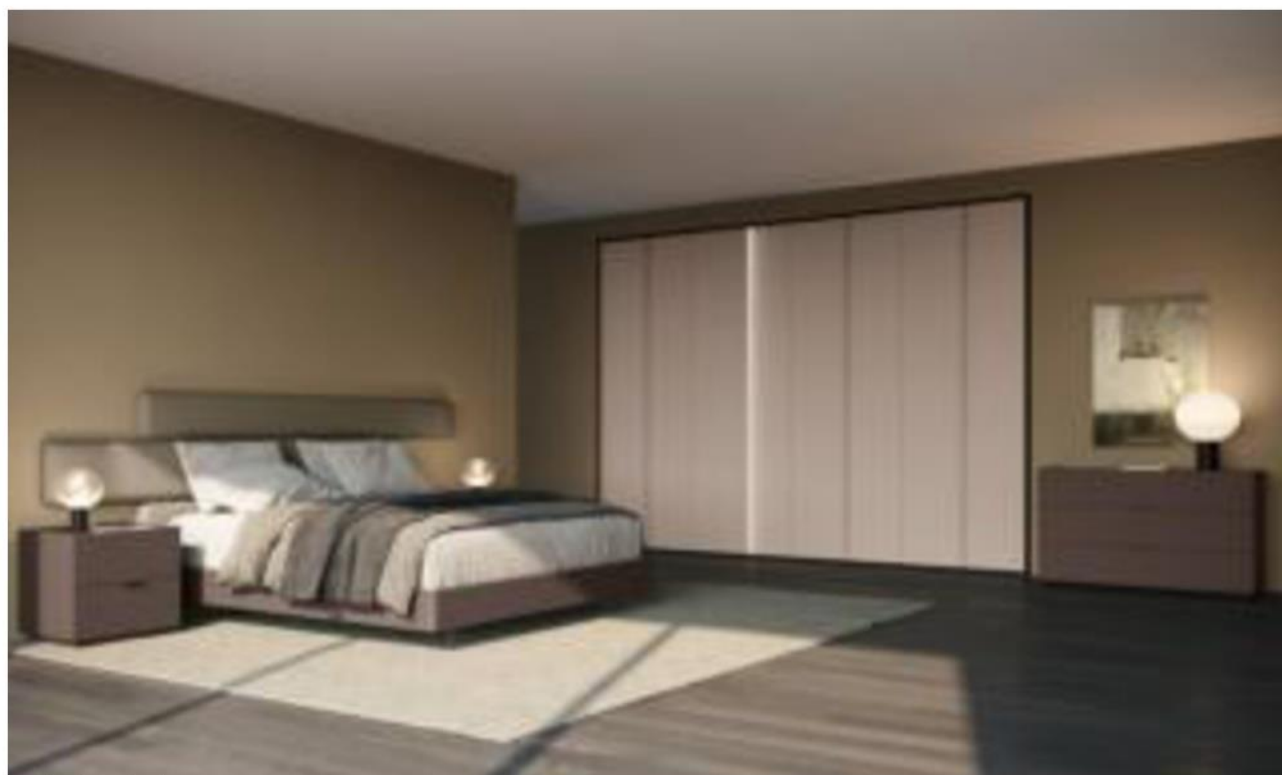
Dido di Febal Casa

Cassettiere laccate, a colori neutri o colorate