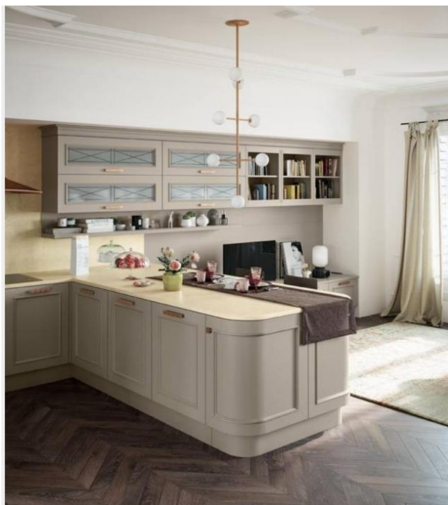
Romantica di Febal Casa

Di sapore retrò, alcuni modelli di cucina con anta a telaio sono connotate da un gusto tradizionale grazie ad alcuni dettagli specifici , come la riquadratura più stondata e "dolce" , dalla presenza di cimase a fare da bordo superiore aggettante, da mensole con spessore frontale decorato .