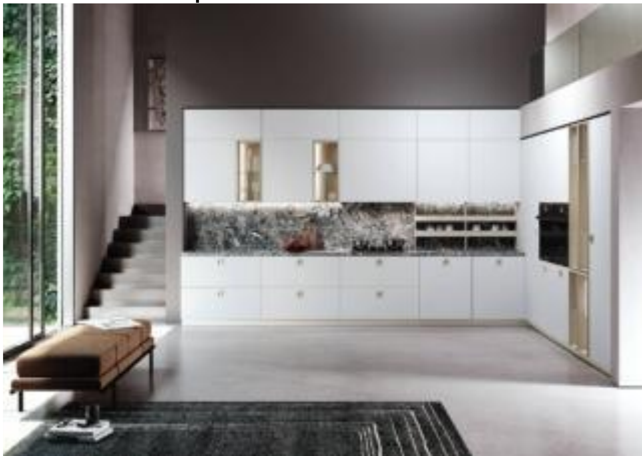
Ego di Febal Casa

Ego di Febal Casa si compone di basi, pensili e colonne in laccato opaco Bianco neve. Top e schienale sono in marmo Grey Saint Laurent spazzolato. Prezzo suggerito di una base da 60 cm, 165 euro. www.febalcasa.com