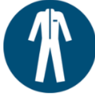
Arbeitskleidung (hohe Sichtbarkeit)