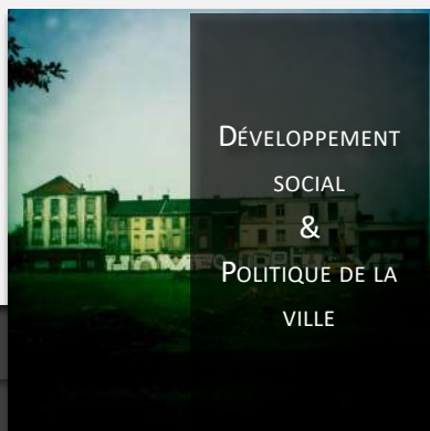
Développement social & Politique de la Ville