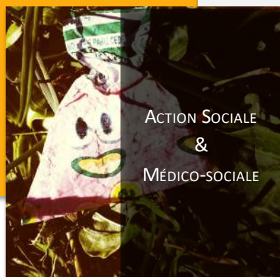
Action Sociale & Médico-sociale