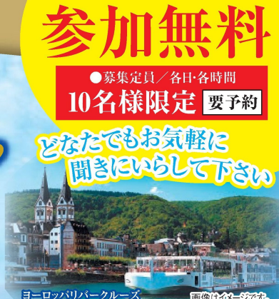
ヨーロッパリバークルーズ