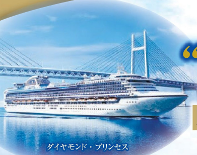
ダイヤモンド・プリンセス