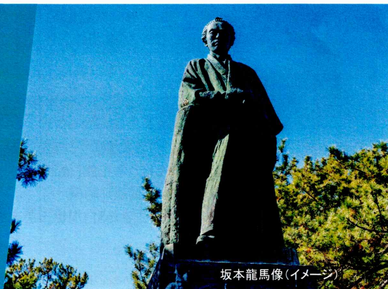
坂本龍馬像(イメージ)

波静かな錦江湾、悠然とそびえる雄大な活火山桜島という世界に誇れる自然景観を有した風光明媚な都市