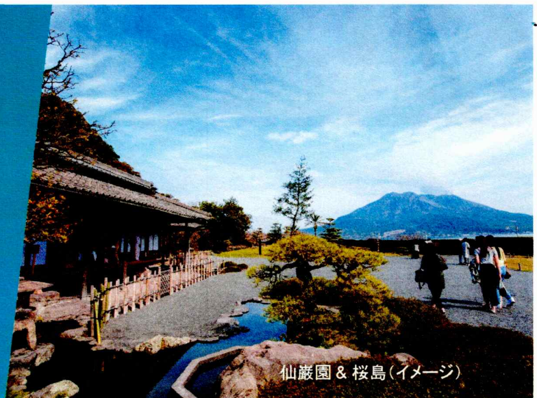
仙巖園 & 桜島(イメージ)

波静かな錦江湾、悠然とそびえる雄大な活火山桜島という世界に誇れる自然景観を有した風光明媚な都市