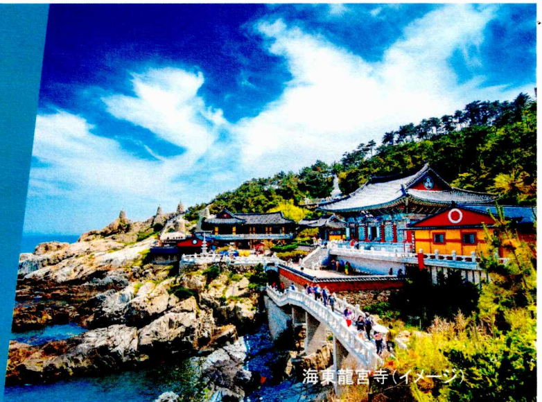
海東龍宮寺(イメージ)

韓国第2の都市と呼ばれ、港町としても有名な釜山。毎年国際映画祭が開催されることでも知られ、気軽に観光を楽しめるスポットが港周辺に多くあります。