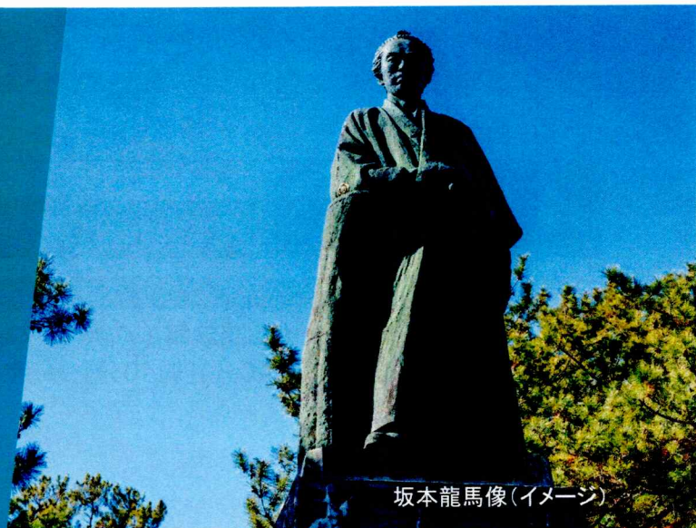
坂本龍馬像(イメージ)

波静かな錦江湾、悠然とそびえる雄大な活火山桜島という世界に誇れる自然景観を有した風光明媚な都市