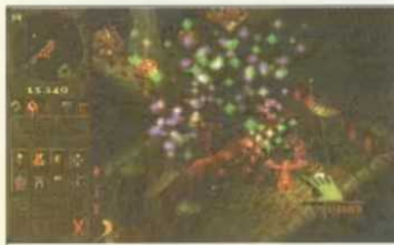
Fertig: Wir haben einen neuen Zauber erforscht