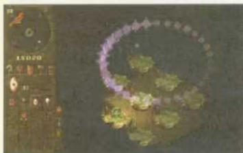
Per Zauberspruch wird der Feind ausspioniert