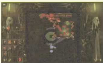
Übersicht dank Karte: Auf der Map gibt's eine Lupe