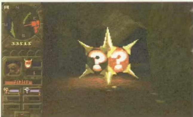
Ein Bonusgegenstand: Ein Geheimlevel wird dadurch aktiviert oder Eure Monster werden alle befördert