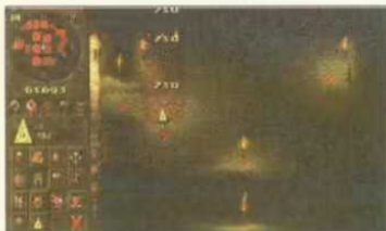
Wir „kaufen“ uns einen neuen Raum