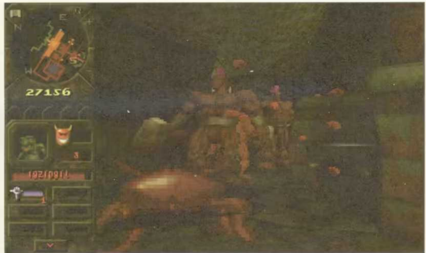
Mächtig: Eine Heldentruppe stapft in unseren Dungeon und wir betrachten das Ganze aus der Sicht einer Kakerlake

K ommt's? Kommt's nicht? Wenn ja, wann kommt es? So lauteten die drei Fragen, die Starspiele-Designer Peter Molyneux auf jeder Messe und bei jedem Telefonanruf zum Thema „Dungeon Keeper“ beantworten mußte. Kein Wunder: Immerhin wurde über kaum ein anderes Programm in den letzten drei Jahren soviel spekuliert wie über den letzten Bullfrog-Titel, an dem Peter Molyneux noch selbst mitwirkt. Mit Vorschußlorbeeren und intensiver Vorberichterstattung wurde in keinem deutschen Magazin gespart, trotzdem tauchten gelegentlich Zweifel auf, ob das Spiel überhaupt noch erscheint. Jetzt hat das Warten, Bangen und Rätselraten ein Ende: „Dungeon Keeper“ ist (endlich) fertig. Aber was ist „Dungeon Keeper“ nun eigentlich? Ist's ein Rollenspiel, ein Strategieprogramm, eine Wirtschaftssimulation, ein Monstermanager, gar hochkomplexes ein Actionspiel? Die Antwort ist