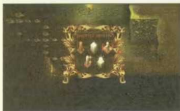
Das Grafikoptionsmenü erlaubt viele Einstellungen