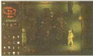
Die „Mistress“-Monster sind besonders gute Kämpfer und trainieren besonders gern