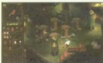
Fleißig: Im Trainingsraum werkeln einige Kreaturen