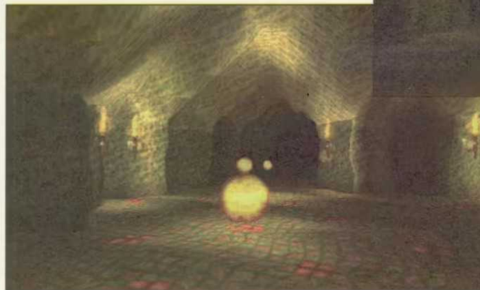
Licht und Schatten: Das dunkle Gewölbe (oben) wird von Fackeln und einem Feuerzauber ordentlich ausgeleuchtet (links)

so klar wie verwirrend: „Dungeon Keeper“ ist nichts davon und alles. Das Spiel ist eine Mischung aus allen Genre-Bereichen und definiert sich als Computerspiele-Unikat — am ehesten läßt es sich wohl noch mit „Populous“ vergleichen. Nur eines ist beim Spielstart sicher: Ihr schlüpft diesmal nicht in die Rolle eines strahlenden Helden, sondern eines bösen Finsterlings, der gerade nichts Besseres zu tun hat, als ein blühendes Märchenreich dem Erdboden gleichzumachen. Habt Ihr Euch für ein Solospiel entschieden, startet Ihr im Tutorial-Modus. Auf einer Landkarte seht Ihr die verschiedenen Provinzen, aus denen das Land besteht, das Ihr