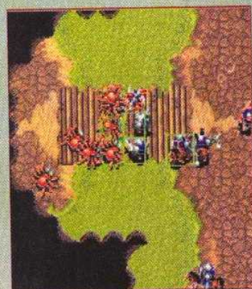
▲ Les araignées sont créées par les magiciens orcs, peu efficace seule, une armée d'araignées peut s'avérer redoutable utilisée comme moyen de diversion.