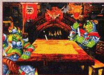
▲ Même les orcs ont droit à un petit briefing avant une mission. Rien n'indique pour autant qu'ils comprennent un traître mot, mais c'est l'intention qui compte.