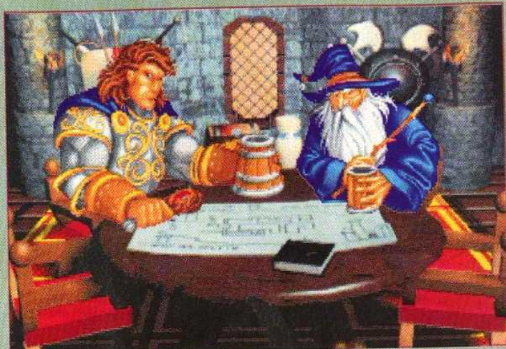
▲ En salle de briefing, le but de votre mission vous est exposé, les scénarii étant parfois très originaux.