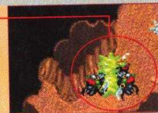
▲ Le slime a une préférence pour le sang orc et s'il doit en triturer quelques uns pour satisfaire son envie, pourquoi pas.