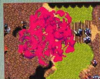
▲ Le magicien orc possède un sort Nuage de poison qui fait même perdre des points d'énergie aux catapultes !