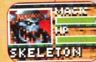
▲ Les magiciens orcs ont la possibilité de donner vie aux os des cadavres. Le squelette heureux de l'opportunité qui lui est donné de pouvoir se mouvoir sans charge de chair superflue fera ce que vous lui demanderez.