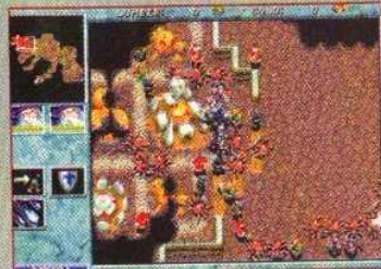
▲ Une attaque finale est toujours un véritable carnage, une friteuse géante !