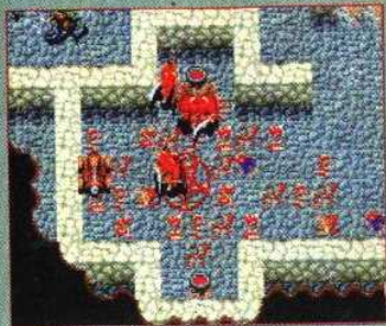
▲ Les démons ont leur place au milieu des donjons couverts de signes ésotériques et de corps mutilés.