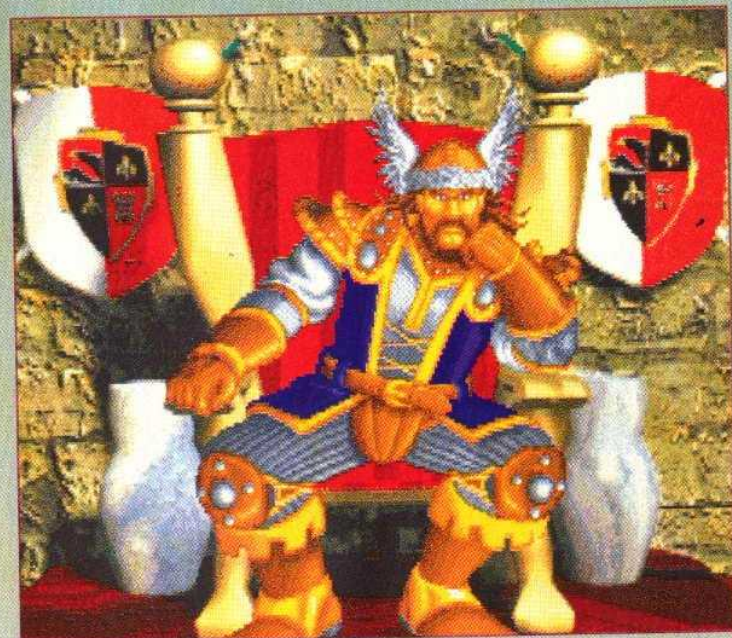
▲ LE ROI ! En cas de victoire définitive contre les orcs, vous avez le privilège de le rencontrer pour lui baiser les bottes. Il vous annonce qu'il faudra maintenant trouver la faille cosmique par laquelle les orcs envahissent notre dimension. Un futur scénario ?

merveilleux Warcraft. L'interface à base d'icônes dessinés de façon éloquent s'avère aussi efficace qu'une batterie de catapultes. Les icônes d'action sont pour les paysans : se déplacer, stopper, réparer, collecter et construire. Pour les soldats : se déplacer, stopper et attaquer. Les sorts des magiciens et des clercs sont identifiables au premier coup d'œil grâce à la qualité et à la finesse des illustrations. Il suffit donc de cliquer sur l'action souhaitée puis sur le personnage choisi pour lui attribuer. On peut sélectionner jusqu'à quatre unités en même temps et les déplacer ou les faire attaquer de concert. Une option qui n'existait pas dans Dune 2 et se révèle plus que pratique. En fait, le seul véritable défaut du jeu réside en l'incroyable bêtise de vos soldats, qui obéissent aveuglément à vos ordres et continueront à s'acharner sur une ferme, même si une dizaine d'ennemis leurs tombent dessus par derrière ! Malgré tout, Warcraft demeure un jeu exceptionnel qui a su s'inspirer du concept de Dune 2 en y apportant quelques améliorations mais surtout un cadre original et plus riche. Un jeu captivant qui fonctionne sur le plus modeste des PC. ■