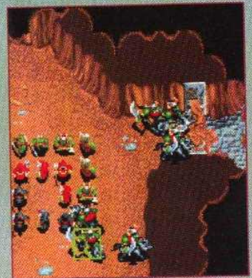
▲ Les portes qui empêchent la progression de vos troupes au cœur des donjons ont une durée de vie très limitée face aux haches orcs.

unités, des baraquements pour entraîner vos armées. Des ateliers de charpentiers pour équiper vos soldats de flèches ou de catapultes ; des forges pour améliorer les armes de vos hommes et consolider leurs défenses à l'aide de meilleurs boucliers ; des écuries pour créer des chevaliers, fièrement juchés sur leur monture, elles aussi entraînées au combat. Il est possible d'hybrider la race chevaline de façon à la rendre plus efficace sur le terrain (un percheron se révélant assez peu efficace contre un orc massif armé d'un coupe-coupe à Séquoia !). Chez les orcs, le chenil remplace avantageusement l'écurie et les loups les chevaux. Les bâtiments de pierre sont voués à ce qui inspire le respect chez ces races primitives : la religion et la magie. L'église et les tours font ainsi fonction d'écoles de magie pour les humains ;