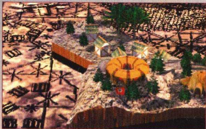
▲ Après le briefing, la nouvelle carte du jeu vous est dévoilée sans pudeur par un zoom lubrique.

pour février 95), Warcraft, tel l'un des quatre chevaux de l'apocalypse m'a fait rechuter dans cet état de déchéance physique que je redoutais tant.