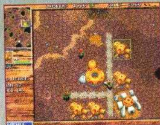
▲ La première mission orc est très facile, il suffit de construire six fermes et d'éliminer les pauvres guerriers humains égarés et esseulés aux quatre coins de la carte.

quelque sorte, avec magie et armes médiévales à la place de la haute technologie de la planète aux épices. Tout comme dans ce dernier vous commencez avec quelques hommes, le plus souvent de simples paysans, quelques fois des soldats. Un bâtiment central vous permet de créer des routes pour étendre votre village, des murs pour le fortifier et de nouveaux paysans, que vous enverrez couper des arbres ou récolter de l'or dans les mines découvertes. Ces matières premières vous permettent alors de demander à l'un des paysans de construire des bâtiments de bois ou de pierre. Des fermes pour nourrir les toujours plus nombreuses