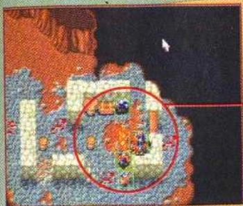
▲ L'élémentaire de feu est un monstre «free lance» qui ne travaille ni pour les humains, ni pour les orcs et les attaque donc sans retenue.