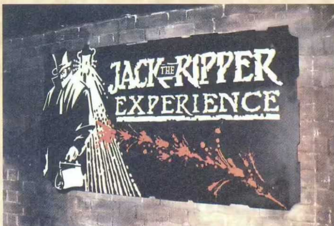
▲ Ripperkult in Reinkultur – die "Experience" im London Dungeon