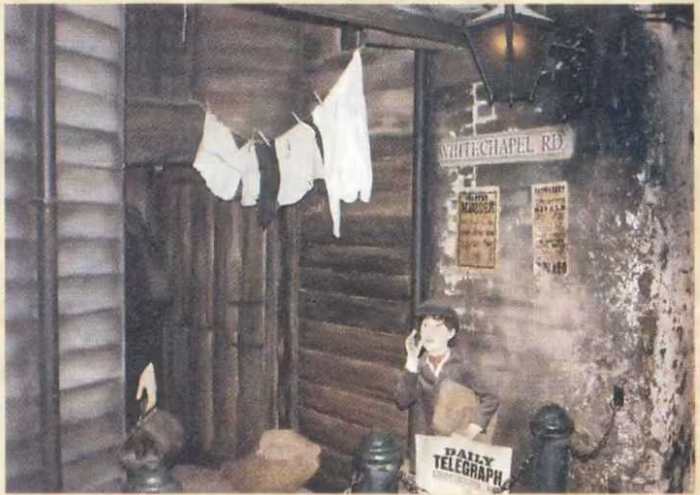
▲ Futter für die Presse, der Würger würgte wieder

◀ Einer der vielen Justizirrtümer, oder vielleicht doch nicht?