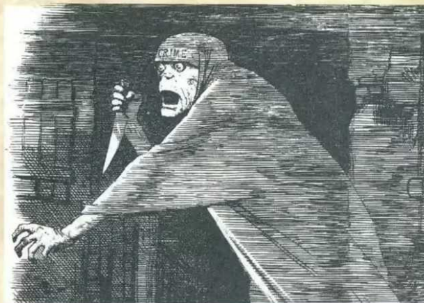
▲ So sah Londons Tagespresse den Ripper