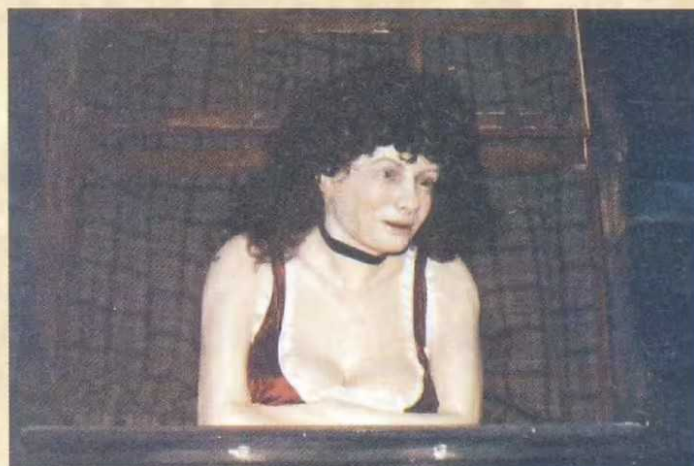
▲ Warte, warte noch ein Weilchen ...