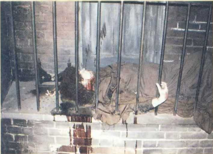
▲ Wirkt doch richtig lebendig, das Modell im London-Dun-deon

Weitere Hinweise können in der Tageszeitung oder durch Absuchen des Tatorts