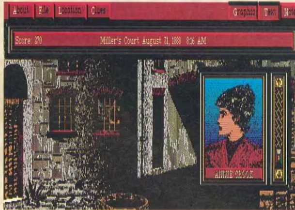
▲ Der Schauplatz des ersten Mordes

Nichtsdestotrotz sind die Grafiken fein gezeichnet und basieren allesamt auf Originalvorlagen. Stimmungsvoll ist das ganze Ambiente auch ohne fotorealistische Sümpfe von Blut, und der Sound-Blaster gibt wunderschöne, klassisch instrumentierte Musik aus den Tagen Jack the Rippers von sich. Das Menüsystem je-