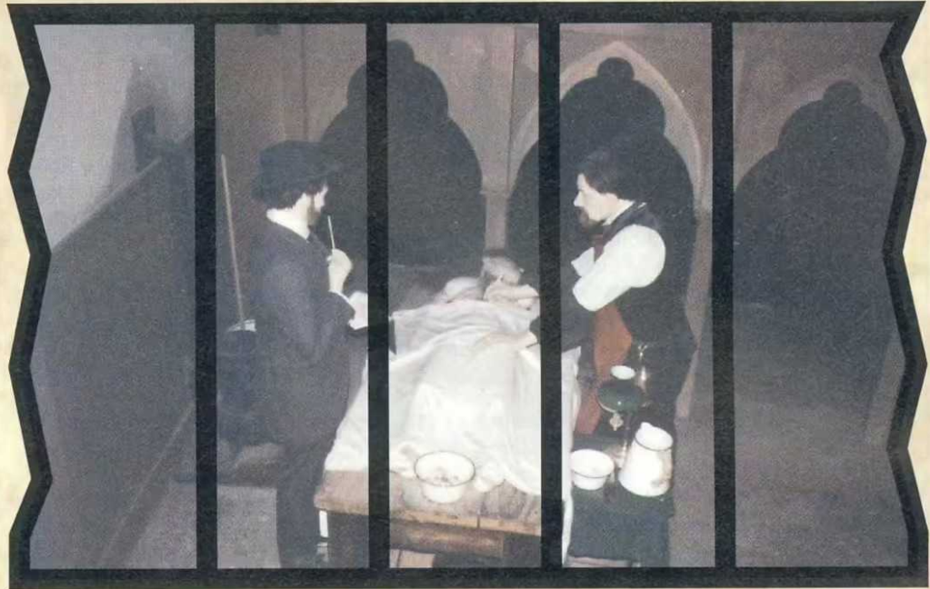
▲ Grübeleien vor grausigem Inventar in der Gerichtsmedizin

Nun, London und ganz besonders der Whitechapel-Bezirk waren in diesen Jahren nicht gerade das, was man als Wohlstandsviertel bezeichnen konnte. Armut