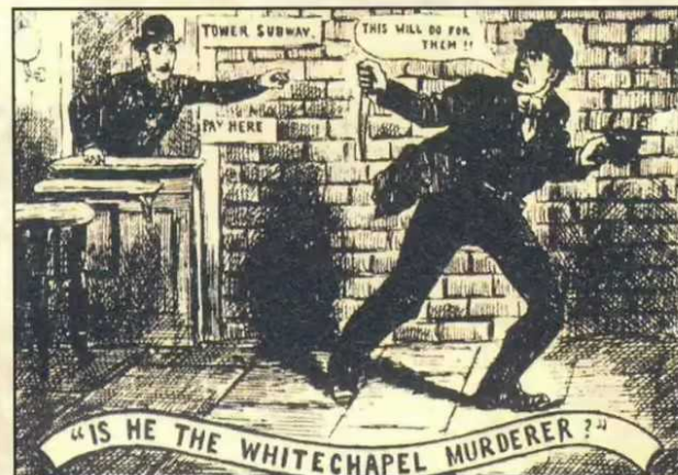
▲ Viktorianisches Hide and Seek, jeder verdächtigt jeden

Langsam machte sich ein gewisser Unmut der Bürger gegenüber der hilflosen Polizei breit. Zeitungen wie das frühe Satiremagazin "Punch" machten sich öffentlich über die Ordnungshüter lustig und verbreiteten weiterhin Panik unter der Bevölkerung. Mittlerweile forderte der Täter die Beamten von Scotland Yard mittels Bekennerbriefen zu einem