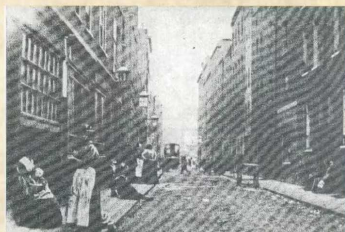
▲ In der Dorset Street ging Jack seinem ungewöhnlichen Hobby nach

Allen, die sich berufen fühlen, noch ein wenig mehr auf den Spuren des Rippers zu wandeln, und öfter mal in London sind, sei ein Besuch im London Dungeons angeraten, der größten Dauerausstellung über die Grausamkeiten der menschlichen Geschichte.