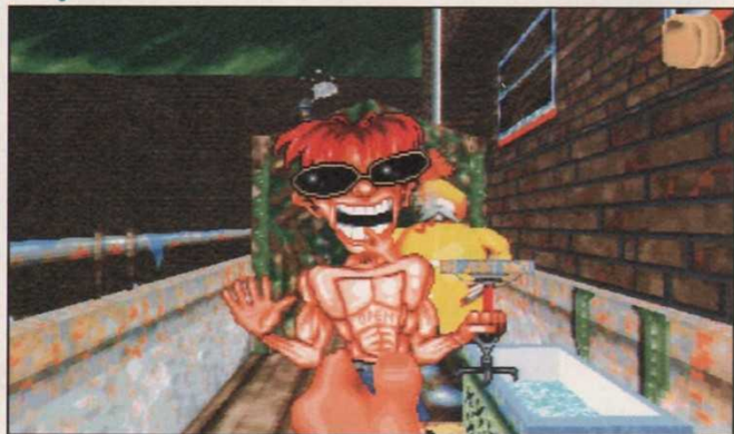
Une interface des plus ergonomiques.

GENRE : Aventure • EDITEUR : Funsoft • DÉVELOPEUR : Gremlin • TEXTES ET VOIX : En français • CONFIG MINI : DX2-66, 8 mégas de Ram, compatible Windows 95