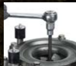
Vain yksi säätöruuvi