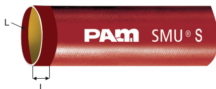
Liitosalue L putken sisä- ja ulkopinnalla