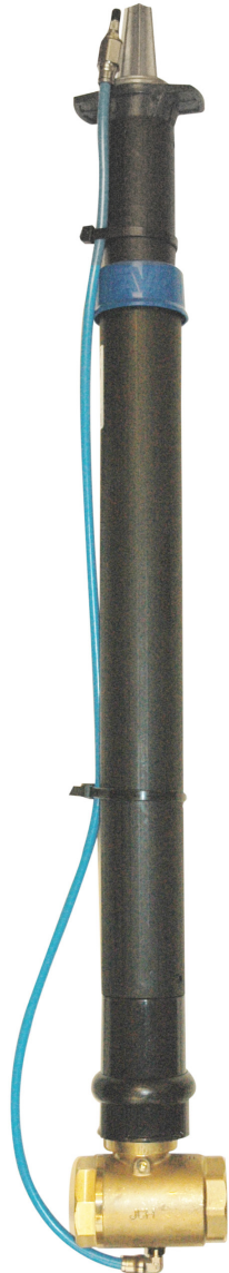
Lisätarvikepaketti paineelliseen tyhjennykseen