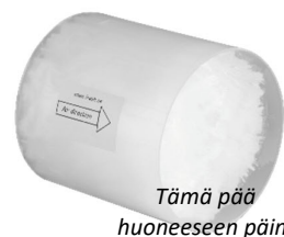
Kuva 3 Flimmer tehosuodatin: Tuotenro 423778 LVI-nro 8823522