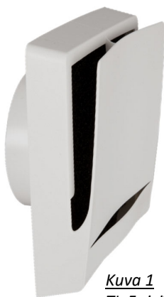
Kuva 1 TL-F sisäosa: Tuotenro 249833 LVI-nro 8823519

TL-F venttiili on tarkoitettu jatkuvaan ilmanvaihtoon, emme siis suosittele venttiilin sulkemista. Jos rakennuksessa on koneellinen poistoilma, se on säädetty poistamaan tietyn määrän ilmaa joka päivä. Mikäli poistuvan ilman tilalle ei tule korvaavaa ilmaa venttiileistä, se tulee rakenteista, mikä on erittäin epäterveellistä sekä rakennukselle että sen asukkaille. (Mikäli välttämätöntä, on venttiilin sulkeminen mahdollista poistamalla ensin kansi käsin vetämällä, liukusäädin löytyy venttiilin alaosasta. Venttiili on täysin auki, kun vipu on oikeassa reunassa.)