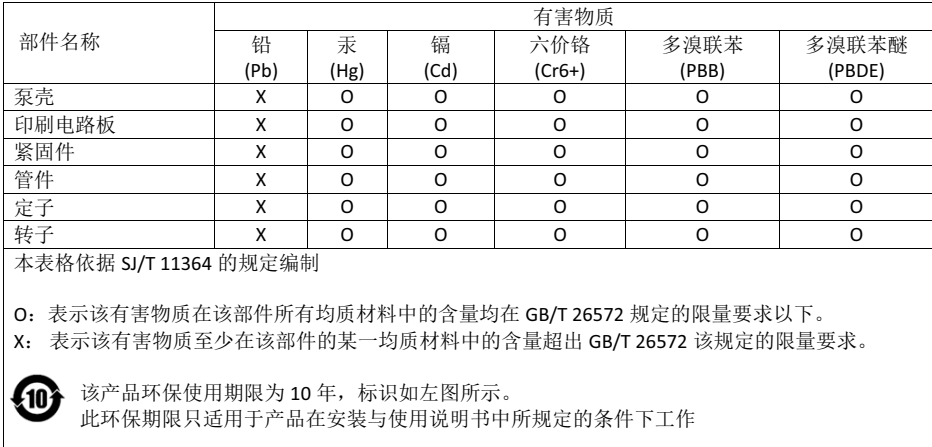
产品中有害物质的名称及含量